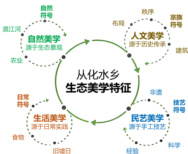
图 1 从化水乡生态美学特征模型图

生活美学聚焦于日常中的文化趣味，龙潭村墟日的竹篓与石秤，通过编织技艺与耐用性隐喻公平伦理；红皮烧猪则以味觉符号强化宗族秩序。这些实践将实用和象征的双重性融入生活场景——竹篓从市集载体演化为商贸信誉，烧猪从祭品升华为身份认同。在此过程中，民艺基因通过日常行为、活动和礼俗渗透到社群记忆中，实现文化意义的代际传递。