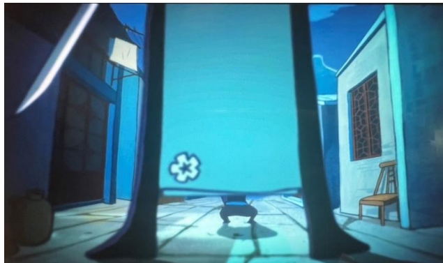
图 11 梅花十三的旗袍上的梅花符号

图 11 展示了第 3 集的一处场景，梅花十三与伍六七正在激烈交锋。在这紧张刺激的打斗场面中，梅花十三身着的旗袍上绣有梅花图案，赋予了这一场景更深的文化背景。梅花在中国文化中有着深厚的象征意义。它代表着坚韧、纯洁和对美好生活的追求。梅花作为寒中孤傲的花，不畏严寒，独自盛开，因此它也常常被用来象征坚韧不拔的性格。这与梅花十三在动画中展现的性格特点高度契合。她