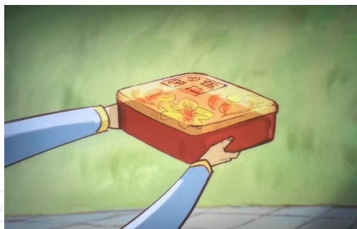
图 8 五仁月饼盒子