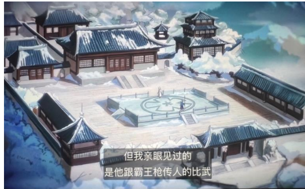
图 3 梅花山庄庄主

如图 3 所示，在第 11 集中，通过梅花十三的回忆，观众得以窥见她与梅花大侠之间的父女情深。这段情节的背景设置在一座经典的四合院中，不仅展现了梅花十三的身世背景，更是将中国深厚的建筑文化巧妙地融入到了动画的叙述之中。