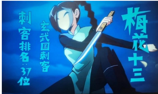
图 6 青绿色旗袍

图 6 展示了第 3 集中的一幕，梅花十三出现并试图对汪疯狗发起攻击，但她并未意识到汪疯狗实际上是伍六七的变身形态。在这一场景中，观众可以清晰地看到梅花十三所穿的是一件经典的旗袍。旗袍，作为中国文化的象征，已经被全球所认知和喜爱。