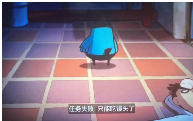
图 2 馒头

如图 2 所示，在第 1 集中，由于伍六七的任务失败导致没有收入，他面临着经济困境。在这种情况下，鸡大保抛给伍六七一个馒头，既为了安慰他，也是因为他们暂时没有其他食物。这个简单的动作，虽然只是一个短暂的插曲，却深刻地展示了馒头在中国饮食文化中的重要地位。