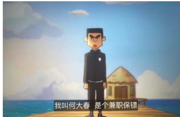
图 7 何大春正在介绍自己

图 7 展示了第 7 集中的一个情节，一位女性请伍六七帮忙刺杀其丈夫。在这过程中，伍六七邂逅了何大春，一个愿为共同利益献身的坚定保镖，两人随后建立了深厚的友情。在这一情境中，导演何小疯不仅为观众展示了中国女性的服饰文化——旗袍，还巧妙地展现了中国男性的经典着装——中山装。众所周知，中山装是毛泽东主席的标志性服饰，他常穿此装出现于公众场合，因此中山装在国际上有时也被称为“毛装”。