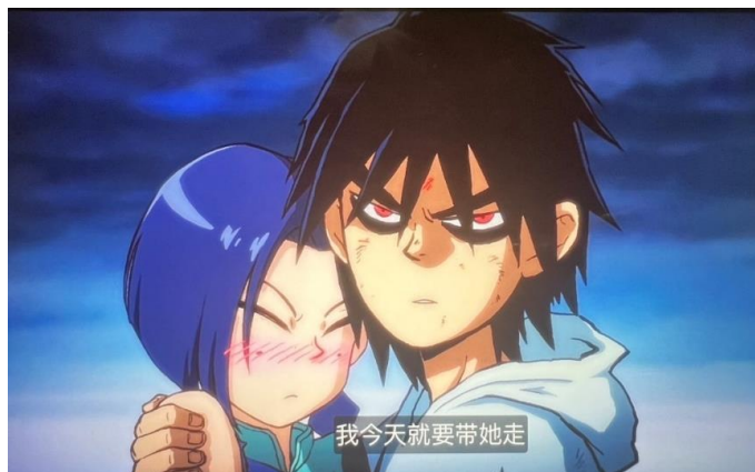
图 10 伍六七正在说粤语