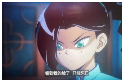
图 4 场景里的窗棂 （图片来源：Netflix）