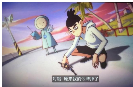
图 9 五六七在捡自己的令牌

图 9 展现了第 1 集中五六七与斯坦国的机器人的一次意外冲突。在这一过程中，五六七的令牌意外掉落，机器人识别到了令牌，紧随其后发起了进攻。令人留意的是，五六七的穿着——他身上的卫衣与短裤虽然简单，但他脚上穿的经典北京老布鞋却承载着深厚的文化传统。