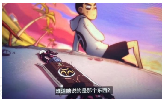
图 15 伍六七的令牌