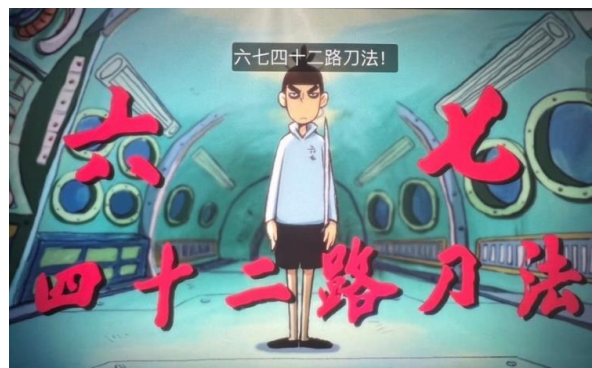
图 12 伍六七讲了自己的剑术

图 12 展示的是第 7 集的一个场景，伍六七与杰克船长激烈交锋。在这一过程中，伍六七运用了剑术，而书法艺术也巧妙地融入了这一场景中。书法在中国被誉为“文字的舞蹈”，因其细腻的笔触、流畅的线条和深邃的意境而受到世人的喜爱和赞誉。