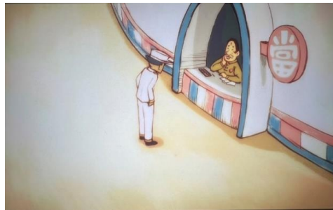
图 14 陈白在卖他的裤子

图 14 展示了第 7 集中伍六七与守卫大叔的对话场景。在此场景中，研究者特别注意到了“當”字的使用，这是“当”的繁体形式。繁体字在中国的历史中占有着特殊的地位，它记录了中国数千年的文化和历史，直到 1956 年前，繁体字一直是中文的标准书写形式。