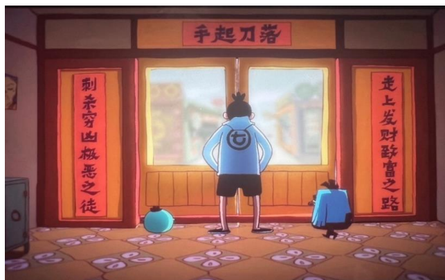
图 5 对联

图 5 展示了第 1 集中伍六七为了掩饰自己的真实身份，选择开设了一家理发店。作为这家店的开业之际，鸡大保为店铺门前贴上了一副对联。这一细节充分展现了中国深厚的民俗文化。