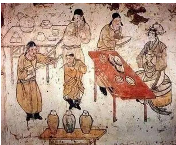
( 图二 )

(图一：《煮汤图》[辽]张恭诤墓壁画：壁画中一童正执扇煮水，炉火正红，一男子端茶盘，盘中有茶二盏，桌上还放有茶托、茶盏。 [5])