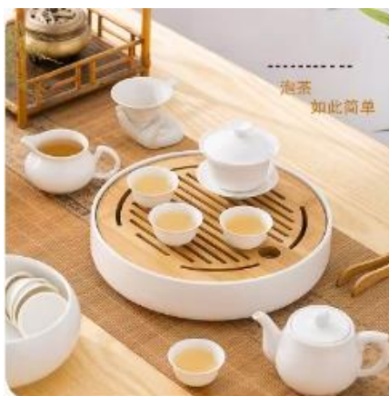
( 图六[13] )

随着现代生活的快速节奏，但泡制潮汕工夫茶依然少不了以下的步骤：第一步：准备好干净的过滤水，水最好是要经过沉淀的，一般需要 2-3 分钟。第二步：放茶叶入茶壶，一般都是放半壶到七成满，冲过后茶叶会展开，刚好呈一壶满的状态。第三步：将煮开的滚烫的热水灌进壶里，经过十来秒后尽快冲出来，第一次水是洗茶的，这主要是出于卫生的考虑，冲泡热水后要轻轻抹开茶沫，斟出茶水，然后冲洗茶具。这道工序还可以起到预热茶具以及保留茶香的作用。第四步：第二次冲热水如茶壶，约 15 秒后尽快斟茶，三个小茶杯放在一起，要轮流不停地来回斟而不能斟满了这杯再斟那杯，这样三个茶杯的茶水浓度均匀，以免出现先浓后淡的情况。