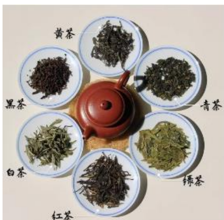
( 图五[13] )