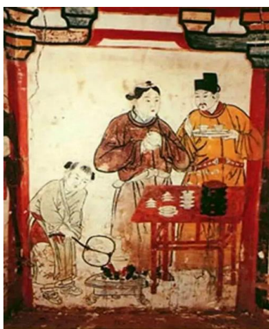
( 图一 )

宋代茶业已有很大发展，推动了茶叶文化的发展，在文人中出现了品茶社团，有官员组成的“汤社”、佛教徒的“千人社”等。宋太祖赵匡胤是位嗜茶之士，在宫廷中设立茶事机关，宫廷用茶已分等级。茶仪已成礼制，皇帝赐茶还赐给国外使节也成为一种风气。至于中下层社会，茶文化更是生机勃勃，有人迁徙，邻里要“献茶”；有客人来访，要敬“元宝茶”；订婚时要“下茶”；结婚时要“定茶”；同房时要“合茶” [4]。民间斗茶风起，带来了采制烹煮的一系列变化。