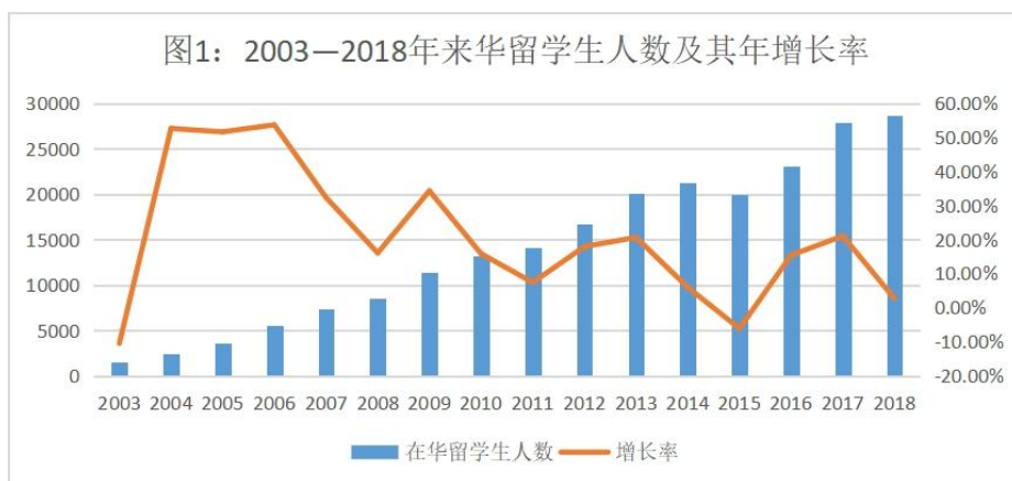
图1显示近十六年泰国留学生人数以及年增长率，由图可知，近十六年泰国留学生人数持续攀升，从2003年的0.1554万人，2005年的0.3594万人，2007年0.7306万人，2009年1.3177万人，2011年1.4145万人，2013年2.0106万人，2015年1.9976万人增长至2018年的2.8608万人，平均增长率23.92%。泰国从2003年的来华留学生源国第六位跃升至2018年的第二大生源国，泰国学生选择去中国留学的比例高达55.11%，说明中国已经成为泰国最受欢迎的留学目的地国家。这一趋势反映了中国高等教育质量和吸引力不断提升，越来越多的泰国留学生愿意选择中国作为他们的留学之地。同时，这也表明中泰两国之间的友好合作关系正在不断加强，特别是在教育领域的交流与合作已经进入了新的阶段。