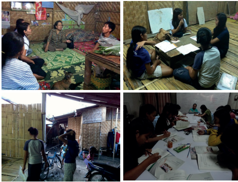
ภาพที่ 1 การศึกษาข้อมูล ณ แคมป์แรงงาน ชาวไทใหญ่

ระยะที่ 2 การสร้างหนังสือเสริมประสบการณ์ซึ่งมีการดำเนินการ ดังนี้