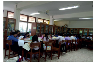
ภาพที่ 3 การนำหนังสือเสริมประสบการณ์ฯ ไปทดลองใช้กับกลุ่มเป้าหมาย