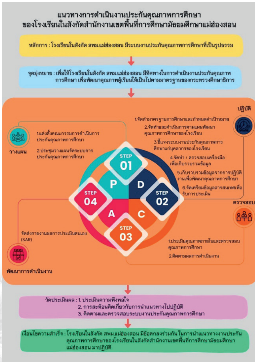
ภาพที่ 2 แนวทางการดำเนินงานประกันคุณภาพการศึกษาของโรงเรียนในสังกัดสำนักงานเขตพื้นที่การศึกษามัธยมศึกษาแม่ฮ่องสอน

จากการวิเคราะห์และสังเคราะห์ข้อมูลที่ได้จาก ระยะที่ 1 และระยะที่ 2 จึงได้เสนอแนวทางการพัฒนางาน ประกันคุณภาพการศึกษาของโรงเรียนในสังกัดสำนักงาน เขตพื้นที่การศึกษามัธยมศึกษาแม่ฮ่องสอน มีรายละเอียด ดังนี้