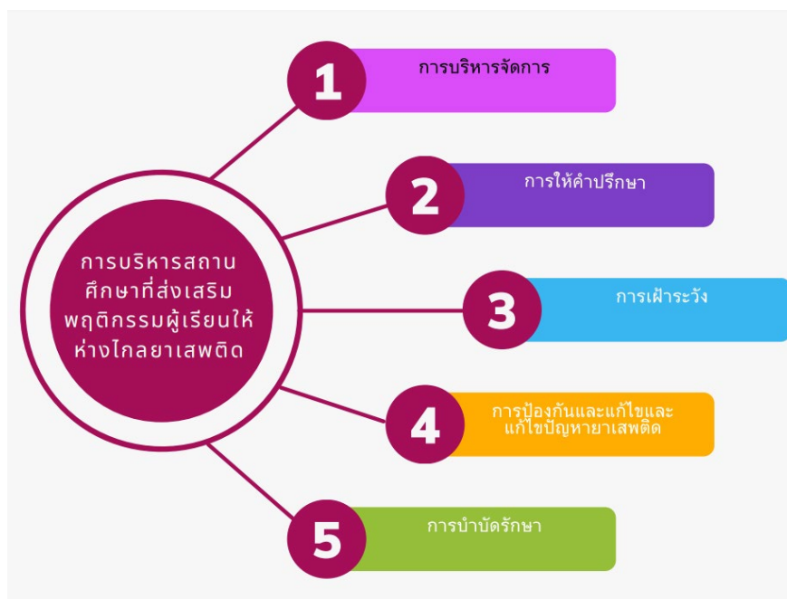
ภาพที่ 2 องค์ความรู้ใหม่จากการวิจัย

การบริหารสถานศึกษาที่ส่งเสริมพฤติกรรมผู้เรียนให้ห่างไกลจากยาเสพติด ในสถานศึกษาสังกัดสำนักงานเขตพื้นที่การศึกษาประถมศึกษาประจวบคีรีขันธ์ เขต 2 มีการดำเนินการในระดับมากที่สุด ภาพรวมและรายด้าน เมื่อจำแนกตามเพศ และประสบการณ์ในการทำงาน ไม่มีความแตกต่างในภาพรวม แต่มีความแตกต่างในรายด้าน และเมื่อจำแนกตามขนาดของสถานศึกษา พบว่ามีความแตกต่างในภาพรวมอย่างมีนัยสำคัญทางสถิติที่ระดับ 0.05 แสดงให้เห็นว่าขนาดของสถานศึกษาทำให้การบริหารสถานศึกษาที่ส่งเสริมพฤติกรรมผู้เรียนให้ห่างไกลจากยาเสพติด ได้ไม่เท่ากันเนื่องจากจำนวนครูในโรงเรียน ถ้ามีน้อยก็ย่อมไม่สามารถดำเนินการด้านอื่นๆ ได้อย่างรอบด้าน สำพังการจัดการเรียนรู้ของครูก็ลำบากอยู่แล้ว สถานศึกษาจึงควรมีเครือข่ายที่จะให้การช่วยเหลือทั้งบุคลากรที่มีความรู้ความสามารถ และทรัพยากรอื่นๆ