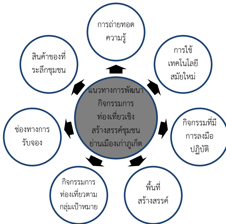
ภาพที่ 2 แนวทางการพัฒนา กิจกรรมการท่องเที่ยวงเชิงสร้างสรรค์ชุมชนย่านเมืองเก่าภูเก็ต