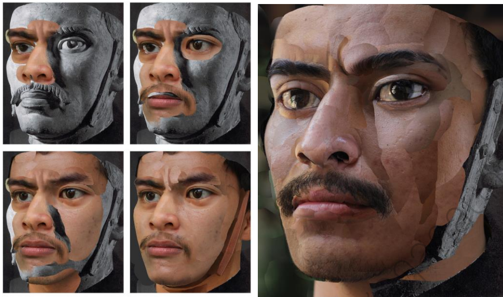
ภาพประกอบ 4 (ซ้าย) : ภาพแสดงขั้นตอนการสร้างสรรค์ ผลงานชิ้นที่ 1