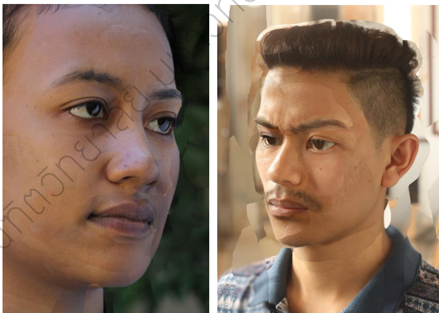
ภาพประกอบ 6 (ซ้าย) : ผลงานสร้างสรรค์ ชิ้นที่ 2