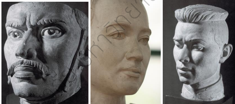
ภาพประกอบ 1 (ซ้าย) : ประติมากรรมต้นแบบ อนุสาวรีย์สมเด็จพระเจ้าตากสิน

2. โครงการสร้างสรรค์ภาพถ่ายเพื่อเป็นสื่อการเรียนรู้ประวัติศาสตร์ไทย ทำให้เกิดแนวทางการนำภาพถ่ายมาประยุกต์ใช้เป็นสื่อการเรียนรู้ประวัติศาสตร์ ที่มากกว่าการใช้เป็นภาพประกอบ แต่สามารถกระตุ้นให้ผู้เรียนเกิดความสงสัยที่นำไปสู่การสร้างทัศนคติต่อการเรียนประวัติศาสตร์ว่า ข้อเสนอพื้นฐานต่อเรื่องใดก็ตามที่เราเชื่อมันจะต้องสัมพันธ์กับหลักฐานที่มี ครั้นต่อมาเมื่อเราพบหลักฐานใหม่ซึ่งพิจารณาแล้วพบว่าข้อเสนอพื้นฐานที่เคยเชื่อนั้นไม่สามารถใช้ได้อีกต่อไป มันก็อยู่ในวิสัยที่จะเปลี่ยนความเชื่อของเราได้