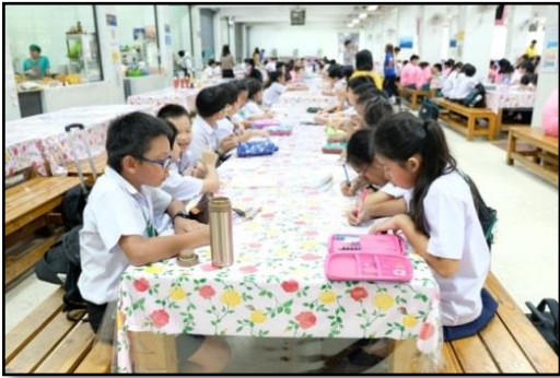
ภาพประกอบ 4 การให้ข้อมูลย้อนกลับโดยตนเอง (self-feedback)