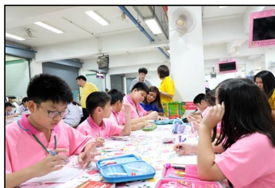
ภาพประกอบ 3 บรรยากาศระหว่างทำแบบสอบอันทันที