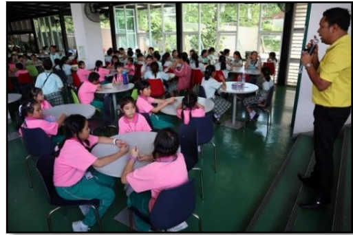
ภาพประกอบ 5 การให้ข้อมูลย้อนกลับโดยเพื่อนร่วมชั้น (peer feedback) โดยการอภิปราย