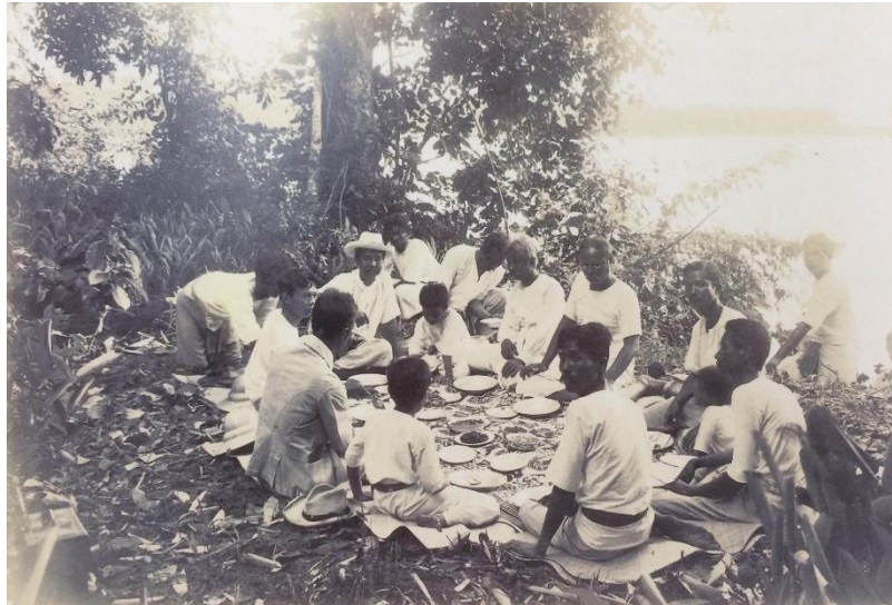
ภาพที่ 3 แสดงการเสวยพระกระยาหารบริเวณตลิ่งสูงในป่าไผ่วังนางร้า

3. ความเป็นมาและการเปลี่ยนแปลงของวัฒนธรรมอาหารชาววัง การสถาปนากรุงรัตนโกสินทร์เป็นราชธานี เป็นการสถาปนาแหล่งสั่งสมอบรมบ่มเพาะของวัฒนธรรมอาหารชาววังของราชสำนักฝ่ายใน โดยยังปรากฏร่องรอยเค้าโครงทั้งความหลากหลายของวัตถุดิบ วิธีการปรุงอาหาร ภาชนะที่ใช้บรรจุอาหาร และความสมดุลของรสชาติที่กลมกล่อม ตามแบบอย่างอาหารชาววังที่มีมาแต่ดั้งเดิม อย่างไรก็ตาม ทั้งสำหรับเจ้านายและสำหรับชาวบ้านต่างมีระเบียบแบบแผนทางวัฒนธรรม คือ การจัดอาหารเข้าสำรับ แต่อาหารชาววังที่มาจากชาวบ้านอาจมีข้อแตกต่างกันในความประณีต พิถีพิถัน การตั้งเครื่องในบรรยากาศแบบชาวบ้าน และอาจเป็นอาหารแบบชาวบ้าน แต่ส่วนประกอบจะไม่มีเปลือก ไม่มีก้าง และไม่มีกระดูก รวมทั้งการใช้วัฒนธรรมอาหารชาววังเปลี่ยนแปลงประเทศสู่ความศิวิไลซ์เพื่อสร้างความทัดเทียมกับอารยประเทศ โดยการเปลี่ยนแปลงธรรมเนียมการรับประทานอาหาร ด้วยการเพิ่มมีด ช้อน และส้อม บนโต๊ะอาหารแทนการเปิบด้วยมือ และการนำวัฒนธรรมอาหารของตะวันตกมาประยุกต์ใช้ในอาหารชาววัง และการใช้มาตราซัง ตวง วัดเพื่อกำหนดมาตรฐานในการปรุงอาหารที่ได้รับอิทธิพลจากชาติตะวันตก ซึ่งความเป็นมาและการเปลี่ยนแปลงของวัฒนธรรมอาหารชาววังได้กลายเป็นบรรทัดฐานของวัฒนธรรมอาหารของไทยในปัจจุบันอย่างกลมกลืน ย่อมเป็นสิ่งที่สะท้อนให้เห็นถึงความเจริญรุ่งเรืองของวัฒนธรรมด้านอาหารของไทยในอดีตด้วยเช่นกัน