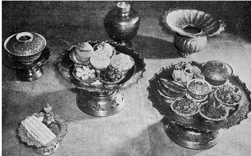
ภาพที่ 1 แสดงการตั้งเครื่องเจ้านายตามแบบอย่างดั้งเดิมในสมัยรัชกาลที่ 9 ที่มา: Sonakul (1959)

2.2 อาหารชาววังที่รับอิทธิพลจากต่างชาติ มีสาเหตุสำคัญจากการเปลี่ยนแปลงประเทศให้ทันสมัยเพื่อสร้างความทัดเทียมทางวัฒนธรรมกับชาติตะวันตก โดยวัฒนธรรมอาหารของชนชั้นนำในช่วงรัชกาลที่ 4 - 5 มีการเปลี่ยนแปลงที่เกิดขึ้นอยู่ 2 ลักษณะ คือ (1) การเปลี่ยนแปลงธรรมเนียมการรับประทานอาหาร มีการใช้อุปกรณ์บนโต๊ะอาหาร คือ มีด ช้อน และส้อม เพิ่มเติมแทนการเปิบด้วยมือแบบดั้งเดิม และ (2) การปรุงอาหาร ที่นำวัฒนธรรมอาหารตะวันตกมาประยุกต์ใช้สำหรับอาหารชาววัง ส่งผลให้วัฒนธรรมอาหารของชาววังเกิดการเปลี่ยนแปลง เช่น การผ่อนปรนรายละเอียดบางประการเพื่อให้สะดวกกับการเดินทางไกล โดยลักษณะการเสวยพระกระยาหารแบบตะวันตกที่ปรากฏหลักฐานภาพถ่ายในสมัยรัชกาลที่ 5 ได้แสดงถึงการตั้งเครื่องเจ้านายในรูปแบบซึ่งแตกต่างกับเครื่องเจ้านายตามแบบอย่างดั้งเดิม ที่ได้ปรับเปลี่ยนธรรมเนียมการรับประทานอาหารมาเป็นการนั่งโต๊ะและการใช้อุปกรณ์บนโต๊ะอาหารตามธรรมเนียมของชาติตะวันตก ดังภาพที่ 2