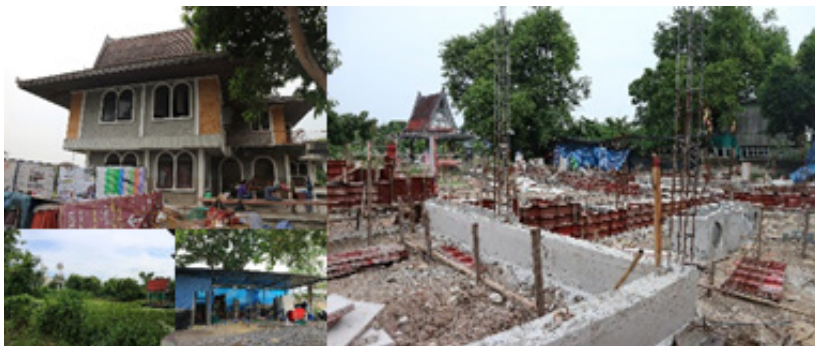
ภาพที่ 5 ศูนย์ฟื้นฟูและพัฒนาศักยภาพคนไร้บ้าน จ.ปทุมธานี

5) ศูนย์ฟื้นฟูและพัฒนาศักยภาพคนไร้บ้าน จ.ปทุมธานี (ภาพที่ 5) เป็นโครงการที่ต่อยอดมาจากศูนย์ศูนย์คนไร้บ้านหมอลิต ซึ่งถูกเวนคืนจากการก่อสร้างทางพิเศษศรีรัช มีเป้าหมายเพื่อเป็นที่พักพิงและฟื้นฟูคุณภาพชีวิต พัฒนาอาชีพให้กับคนไร้บ้านในย่านดอนเมือง จตุจักร ปทุมธานี และรังสิต มีพื้นที่ประมาณ 2 ไร่ 2 งานเศษ มีลักษณะเป็นอาคาร 2 ชั้น 1 หลัง และมีอาคารเดิมสูง 2 ชั้นอีก 1 หลัง สามารถรองรับคนไร้บ้านในได้ประมาณ 100 คน