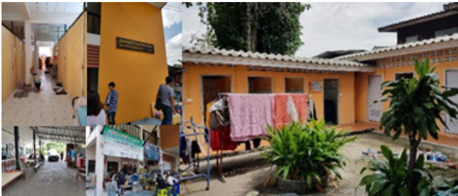
ภาพที่ 2 ศูนย์พักพิงคนไร้บ้านสุวิทย์ วัดหนู (บางกอกน้อย)

2) ศูนย์พักพิงคนไร้บ้าน สุวิทย์ วัดหนู (ศูนย์บางกอกน้อย) (ภาพที่2) มีวัตถุประสงค์เพื่อเป็นศูนย์นำร่องในการแก้ไขปัญหาคอนไร้บ้านให้กับหน่วยงานและองค์กรทั่วไป การจัดตั้งศูนย์เป็นผลสืบเนื่องมาจากนโยบายการจัดระเบียบพื้นที่สนามหลวงในปี พ.ศ. 2544 กรุงเทพมหานครจึงช่วยเหลือ โดยให้มีการจัดสร้างศูนย์พักพิงคนไร้บ้านที่ให้อาศัยและบริหารจัดการศูนย์ด้วยตัวเอง ต่อมากลุ่มคนไร้บ้านจึงมองหาที่ดินเพื่อจัดตั้งศูนย์และเสนอให้มีการเช่าที่ดินของการรถไฟ โดยได้รับการสนับสนุนช่วยเหลือจากสถาบันพัฒนาองค์กรชุมชนฯ ดำเนินการเช่าที่จากทางรถไฟ และกลุ่มคนไร้บ้านได้ทำโครงการเสนองบประมาณจาก พอช. เพื่อใช้ปลูกสร้างอาคาร ปัจจุบันศูนย์ฯรองรับคนไร้บ้านได้ประมาณ 70 คน เป็นอาคารสำหรับพักอาศัยสูง 2 ชั้น 1 หลัง และอาคารห้องน้ำภายนอก 1 หลัง นับเป็นสถานที่ซึ่งมีแม่แบบการทำงานและดูแลภายใต้เครือข่ายคนไร้บ้าน และเป็นแม่แบบให้กับศูนย์พักชั่วคราวคนไร้บ้านทั้งของภาครัฐและภาคประชาสังคมในเวลาต่อมา