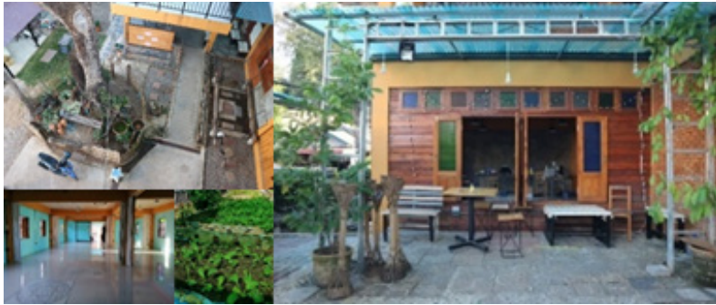
ภาพที่ 3 ศูนย์ฟื้นฟูและพัฒนาศักยภาพคนไร้บ้าน จ. เชียงใหม่ หรือบ้านเต็มฝัน

4) ศูนย์ฟื้นฟูและพัฒนาศักยภาพคนไร้บ้าน จ. ขอนแก่น หรือบ้านโฮมแสนสุข (ภาพที่ 4) มีเป้าหมายเพื่อเป็นที่พักพิงและฟื้นฟูคุณภาพชีวิต พัฒนาอาชีพให้กับคนไร้บ้านในจังหวัดขอนแก่น เริ่มก่อสร้างอาคารช่วงเดือนสิงหาคม พ.ศ. 2561 และมีลักษณะเป็นอาคาร 1 ชั้นครึ่ง 1 หลังขนาด 880 ตารางเมตร บนพื้นที่ทั้งหมด 3 ไร่ สามารถรองรับได้จำนวน 136 คน