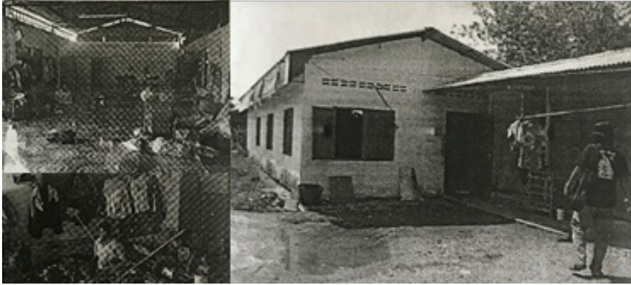
ภาพที่ 1 ศูนย์พักพิงคนไร้บ้านตลิ่งชัน

2) ศูนย์พักพิงคนไร้บ้าน สุวิทย์ วัดหนู (ศูนย์บางกอกน้อย) (ภาพที่2) มีวัตถุประสงค์เพื่อเป็นศูนย์นำร่องในการแก้ไขปัญหาคอนไร้บ้านให้กับหน่วยงานและองค์กรทั่วไป การจัดตั้งศูนย์เป็นผลสืบเนื่องมาจากนโยบายการจัดระเบียบพื้นที่สนามหลวงในปี พ.ศ. 2544 กรุงเทพมหานครจึงช่วยเหลือ โดยให้มีการจัดสร้างศูนย์พักพิงคนไร้บ้านที่ให้อาศัยและบริหารจัดการศูนย์ด้วยตัวเอง ต่อมากลุ่มคนไร้บ้านจึงมองหาที่ดินเพื่อจัดตั้งศูนย์และเสนอให้มีการเช่าที่ดินของการรถไฟ โดยได้รับการสนับสนุนช่วยเหลือจากสถาบันพัฒนาองค์กรชุมชนฯ ดำเนินการเช่าที่จากทางรถไฟ และกลุ่มคนไร้บ้านได้ทำโครงการเสนองบประมาณจาก พอช. เพื่อใช้ปลูกสร้างอาคาร ปัจจุบันศูนย์ฯรองรับคนไร้บ้านได้ประมาณ 70 คน เป็นอาคารสำหรับพักอาศัยสูง 2 ชั้น 1 หลัง และอาคารห้องน้ำภายนอก 1 หลัง นับเป็นสถานที่ซึ่งมีแม่แบบการทำงานและดูแลภายใต้เครือข่ายคนไร้บ้าน และเป็นแม่แบบให้กับศูนย์พักชั่วคราวคนไร้บ้านทั้งของภาครัฐและภาคประชาสังคมในเวลาต่อมา