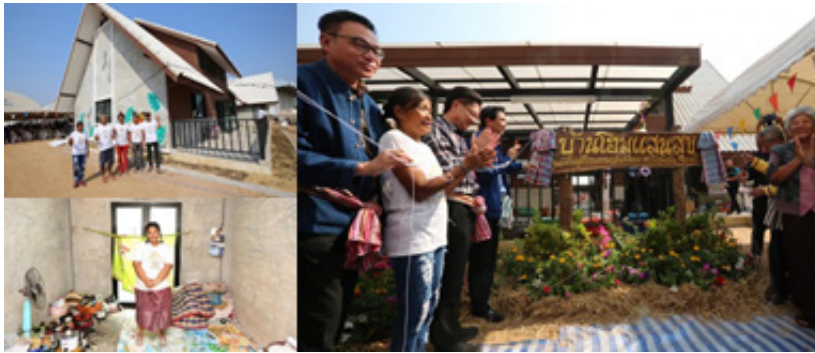
ภาพที่ 4 ศูนย์ฟื้นฟูและพัฒนาศักยภาพคนไร้บ้าน จ. ขอนแก่น หรือบ้านโฮมแสนสุข

4) ศูนย์ฟื้นฟูและพัฒนาศักยภาพคนไร้บ้าน จ. ขอนแก่น หรือบ้านโฮมแสนสุข (ภาพที่ 4) มีเป้าหมายเพื่อเป็นที่พักพิงและฟื้นฟูคุณภาพชีวิต พัฒนาอาชีพให้กับคนไร้บ้านในจังหวัดขอนแก่น เริ่มก่อสร้างอาคารช่วงเดือนสิงหาคม พ.ศ. 2561 และมีลักษณะเป็นอาคาร 1 ชั้นครึ่ง 1 หลังขนาด 880 ตารางเมตร บนพื้นที่ทั้งหมด 3 ไร่ สามารถรองรับได้จำนวน 136 คน