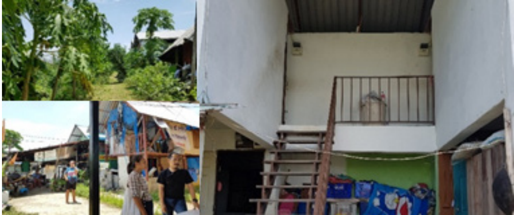
ภาพที่ 6 ชุมชนใหม่คนไร้บ้าน พุทธมณฑลสาย 2

จากการจัดตั้งและดำเนินการศูนย์พักพิงคนไร้บ้านที่ผ่านมามีผลสำเร็จหนึ่งที่ปรากฏคือ “ชุมชนใหม่คนไร้บ้าน” ซึ่งเป็นโครงการต่อเนื่องจากการดำเนินการจัดตั้งศูนย์พักพิงคนไร้บ้าน โดยเปิดโอกาสให้คนไร้บ้านจากศูนย์พักพิงคนไร้บ้านตลิ่งชัน และศูนย์พักพิงคนไร้บ้านสุวิทย์ วัดหนู (บางกอกน้อย) ที่มีความพร้อมออกไปมีบ้านเป็นของตนเองและอยู่ร่วมกันเป็นชุมชน โดยมีการเช่าที่ดินของการรถไฟภายใต้การดำเนินการโครงการบ้านมั่นคง เครือข่ายสลัม 4 ภาค นับว่าเป็นโครงการนำร่องในการสร้างที่อยู่อาศัยที่มั่นคงสำหรับคนไร้บ้าน ปัจจุบันมีคนไร้บ้านย้ายเข้าไปอยู่อาศัยในพื้นที่แล้วมากกว่า 20 ราย (สำนักบ้านมั่นคง สถาบันพัฒนาองค์กรชุมชน (องค์การมหาชน), 2561) (ภาพที่ 6)