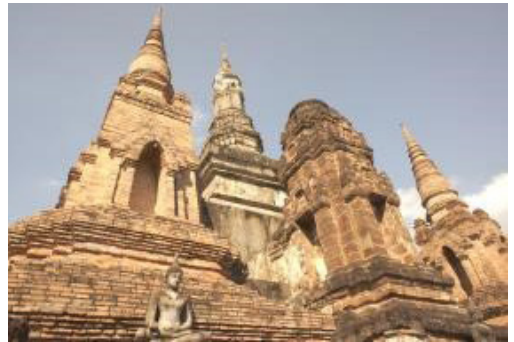
ภาพที่ 2 กลุ่มเจดีย์ประธานวัดมหาธาตุ สุโขทัย ภายในอุทยานประวัติศาสตร์สุโขทัย ที่มีการบูรณะ เสริมเติมองค์ประกอบทางสถาปัตยกรรมให้ครบ