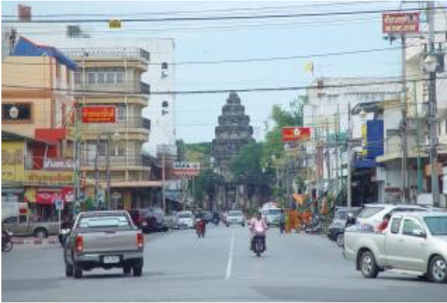
ภาพที่ 16 มุมมองด้านทิศใต้ของเมืองพิมาย ที่มองเห็นปราสาทหินพิมายเป็นฉากหลังในปัจจุบัน