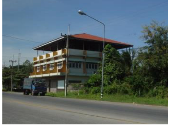
ภาพที่ 15 อาคารที่สร้างทับบนพื้นที่สระน้ำโบราณ (บารายใหญ่)

อุทยานประวัติศาสตร์พิมาย เพื่อแก้ปัญหาการบุกรุกพื้นที่และทำลายโบราณสถาน รวมถึงการศึกษาในการดำเนินงานอนุรักษ์มรดกทางวัฒนธรรม (คณะสถาปัตยกรรมศาสตร์ ผังเมืองและภูมิสถาปัตย์, 2552) ปัจจุบันโครงการดังกล่าวได้ดำเนินการตามแผนเพียงแค่การอนุรักษ์โบราณสถานเพียงเท่านั้น แต่ยังไม่สามารถ ดำเนินการเรื่องการบุกรุกพื้นที่ได้ รวมถึงยังประสบปัญหาเกี่ยวกับการประกาศขอบเขตโบราณสถานที่ยังเป็นข้อพิพาทระหว่างประชาชนในพื้นที่กับหน่วยงานกรมศิลปากร