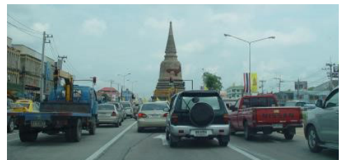
ภาพที่ 8 เจดีย์วัดสามปลื้ม การตัดถนนโรจนะ

ในปี พ.ศ.2520 จึงได้มีการริเริ่มการจัดตั้งอุทยานประวัติศาสตร์พระนครศรีอยุธยาขึ้นเพื่อทำการบูรณะ ปรับปรุงโบราณสถานอย่างจริงจัง ก่อนหน้านั้นในปี พ.ศ. 2499 ได้มีการบูรณะปฏิสังขรณ์วิหารหลวงพอมงคลบิดร โดยใช้เงินที่ได้รับบริจาคจากนายอนุ ผู้นำพม่า สบทบกับงบประมาณรัฐบาลไทย การบูรณะครั้งนี้ได้ทำตามแบบร่างของสมเด็จพระเจ้าฟ้ากรมพระยานริศรานุวัดติวงศ์ ที่ทรงศึกษารูปแบบที่ใกล้เคียงกับวิหารสมัยพระเจ้าอยู่หัวบรมโกศ ให้มากที่สุด โครงการดังกล่าวถือเป็นการบูรณะสร้างอาคารขึ้นมาใหม่ในพื้นที่เดิม (สมชาติ จึงสิริอารักษ์, 2555)