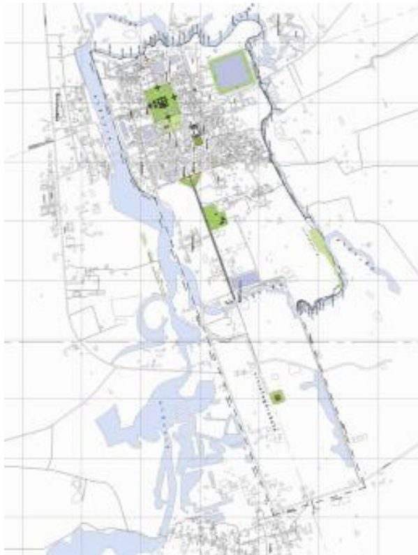
ภาพที่ 11 ขอบเขตพื้นที่อุทยานประวัติศาสตร์พิมาย

โดยฝ่ายไทยมีหม่อมเจ้ายาใจ จิตรพงษ์ เป็นผู้รับผิดชอบดำเนินโครงการ ใช้เวลาดำเนินโครงการ 6 ปี การบูรณะจึงแล้วเสร็จ (ปิ่นรัชฎ์ กาญจนนัฐิติ, 2552)