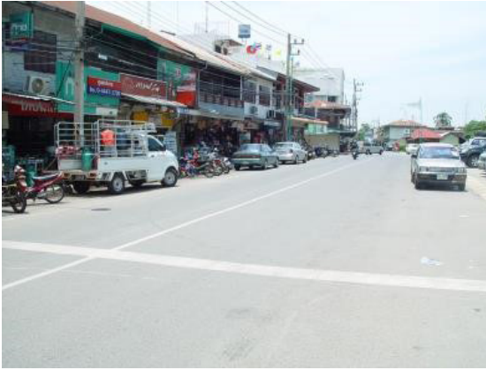
ภาพที่ 14 อาคารแถวที่เปิดเป็นร้านค้าพาณิชย์ที่ตั้งอยู่ ด้านหน้าปราสาทหินพิมาย และสร้างทับบนพื้นที่สระน้ำโบราณ