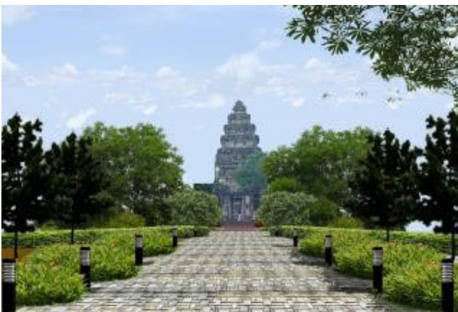
ภาพที่ 18 แนวอนุรักษ์แบบสุดขีด ทุกอย่างหายไป เหลือแต่โบราณสถาน กับการจัดภูมิทัศน์ใหม่ ที่ปราศจากชีวิต