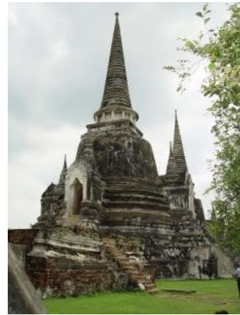
ภาพที่ 7 เจดีย์วัดพระศรีสรรเพชญ์ที่ได้รับการอนุรักษ์ ก่อนปูนพอกใหม่ ถือเป็นแนวทางการอนุรักษ์ ที่ไม่ดำเนินการตามหลักการของกฎบัตรสากล