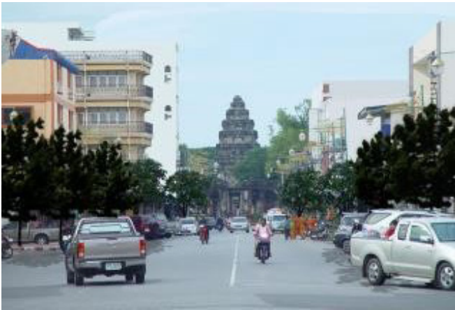
ภาพที่ 17 แนวทางการอนุรักษ์ทางเลือก ควบคุมป้ายโฆษณา และเสาไฟฟ้า เพื่อเพิ่มส่งเสริมมุมมอง ของตัวปราสาทหินพิมายให้โดดเด่น แนวทางนี้ เน้นให้คนยังมีส่วนในการดำรงอยู่ร่วมกับ โบราณสถานทำให้เมืองยังคงมีชีวิตอยู่