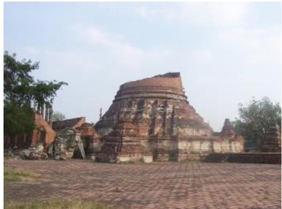
ภาพที่ 10 ภายในโบราณสถานวัดกุฎีดาว ที่มีการปูพื้นด้วยกระเบื้องดินเผาทั้งวัด การอนุรักษ์เกิดขึ้นในปี พ.ศ.2544-2545