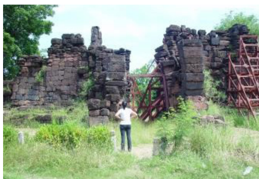
ภาพที่ 13 ประตูเมืองพิมายด้านทิศเหนือ ปัจจุบันอยู่ในระหว่างรอกการอนุรักษ์

กรมศิลปากรได้ดำเนินการขุดแต่งและบูรณะ โดยของงบประมาณเป็นรายปีต่อเนื่องเรื่อยมาจนกระทั่งมีการจัดตั้งให้เป็นอุทยานประวัติศาสตร์พิมายขึ้น ในวันที่ 12 เมษายน พ.ศ. 2532 ในพื้นที่นอกเหนือจากตัวปราสาทหิน ที่ถือเป็นโบราณสถานที่สำคัญแล้ว ภายในอุทยานประวัติศาสตร์พิมายยังประกอบด้วยโบราณสถานอีกหลายแห่ง เช่น เมรุพรหมทัต กุฎิฤๅษี ที่เป็นอโรคยาศาลประจำเมือง กำแพงเมือง ประตูเมืองทิศต่าง ๆ และสระน้ำโบราณ (บาราย) ซึ่งโบราณสถานในปัจจุบันบางแห่งได้รับการอนุรักษ์ให้อยู่ในสภาพที่สมบูรณ์แล้ว แต่บางแห่งก็ยังคงอยู่ในสภาพที่ขาดการดูแล เช่น ประตูเมืองด้านทิศเหนือภาพที่ 13) ที่ปัจจุบันทรุดโทรมและมีการสร้างค้ำยันเหล็กไว้รอการบูรณะในอนาคต (คณะสถาปัตยกรรมศาสตร์ ผังเมืองและนฤมิตศิลป์, 2552)