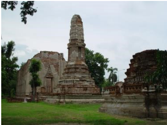
ภาพที่ 9 พระปรางค์วัดบรมพุทธาราม ที่ได้รับการอนุรักษ์ ในปี พ.ศ. 2545 ด้วยการต่อยอดขึ้นใหม่ แบบไม่ถูกสัดส่วน