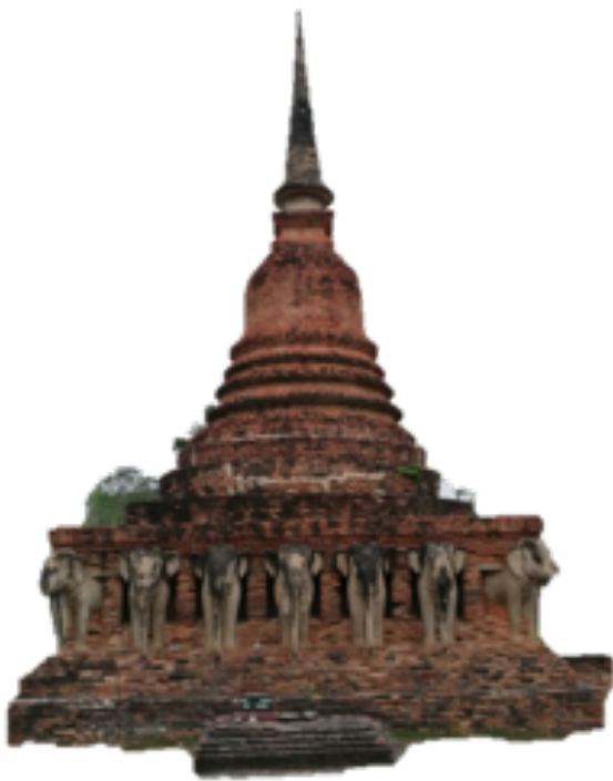
ภาพที่ 4 เจดีย์วัดศรีศักดิ์ ภายในอุทยานประวัติศาสตร์สุโขทัยเป็นเจดีย์ ที่ได้รับการบูรณะขึ้นใหม่ทั้งองค์ ในปี พ.ศ.2536