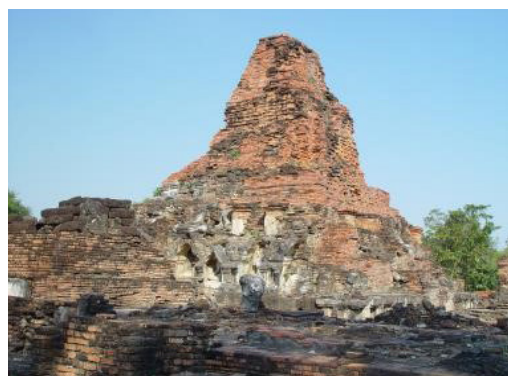
ภาพที่ 5 เจดีย์ภายในวัดพระพายหลวง ที่มีการ บูรณะเพิ่มเติมจนผิดรูปแบบ อันเป็นการลบเลือนหลักฐาน ทางประวัติศาสตร์ และสร้างหลักฐานเท็จ