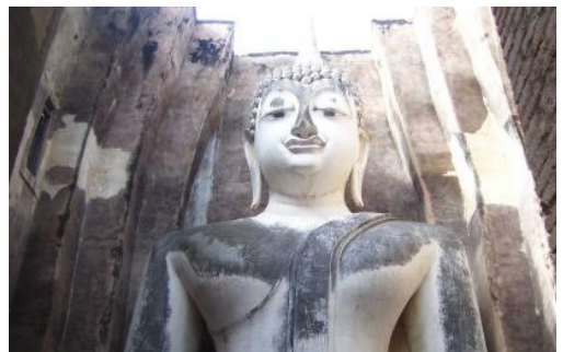
ภาพที่ 3 พระอจนะ ภายในมณฑปวัดศรีชุม ที่บูรณะองค์พระขึ้นใหม่หมดทั้งองค์