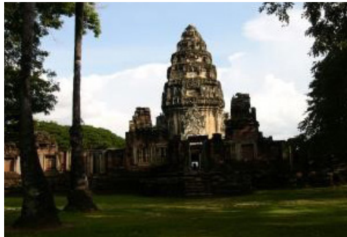
ภาพที่ 12 ปราสาทหินพิมาย โบราณสถาน ที่สำคัญ ในอุทยานประวัติศาสตร์พิมาย