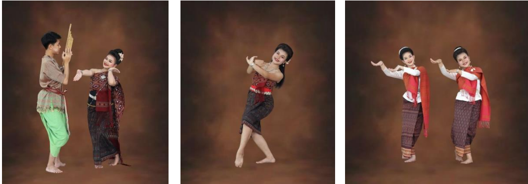
ภาพที่ 2 ชุดการแสดงที่เกิดการช่วงชิงพื้นที่ในการนำเสนอผลงาน