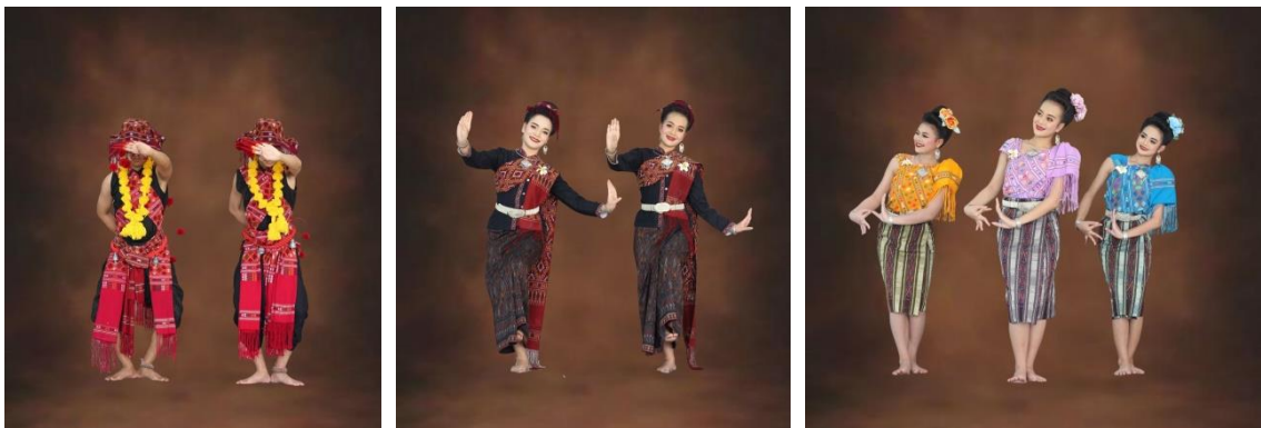
ภาพที่ 1 ชุดการแสดงที่เกิดจากลักษณะทางสังคมและภูมิปัญญา

พื้นที่จังหวัดกาฬสินธุ์เป็นพื้นที่ที่มีความหลากหลายทางด้านชาติพันธุ์เป็นจำนวนมากโดยเฉพาะ “กลุ่มชาติพันธุ์ภูไท” ซึ่งในจังหวัดกาฬสินธุ์นี้มีชาวภูไทตั้งรกรากถิ่นฐานอยู่ในแถบพื้นที่ อำเภอกุฉินารายณ์ อำเภอกำม่วง อำเภอกวาง และอำเภอสหัสขันธ์ ชาวภูไทนั้นมีขนบธรรมเนียมและประเพณีคล้ายคลึงกันกับกลุ่มไทลาว แต่จะมีเอกลักษณ์เป็นจุดเด่นหลายประเภทที่ดูแตกต่างจากกลุ่มอื่น เช่น การแต่งกาย ภาษา ศิลปะ การฟ้อนรำ และดนตรี เป็นต้น โดยเฉพาะ “ผ้าไหมแพรวา” ศิลปะการทอผ้าอันมีเอกลักษณ์ที่เกิดจากภูมิปัญญาท้องถิ่นของชาวภูไท ความโดดเด่นนี้จึงเป็นสิ่งที่สะท้อนให้เห็นถึงความสำคัญของกลุ่มชนที่มีเอกลักษณ์และอัตลักษณ์โดดเด่นเฉพาะตัว บ่งบอกถึงรากเหง้าตัวตนของกลุ่มชน ที่ได้รับการสืบทอดมาจากรบรรพบุรุษ โดยเฉพาะมีความมุ่งมั่นในการรักษาขนบธรรมเนียมวัฒนธรรมประเพณีของตนไว้อย่างเหนียวแน่น