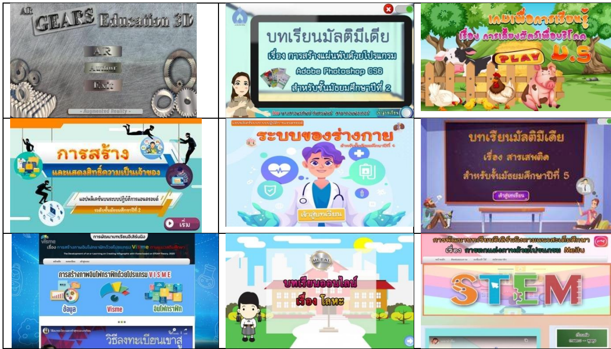
รูปที่ 2 แสดงผลงานนวัตกรรมโครงการพิเศษด้านคอมพิวเตอร์ศึกษา

ตารางที่ 2 ผลการประเมินความสามารถในด้านการคิดสร้างสรรค์และนวัตกรรมของนักศึกษา โดยวัดจากแบบประเมินโครงการพิเศษด้านคอมพิวเตอร์ศึกษา