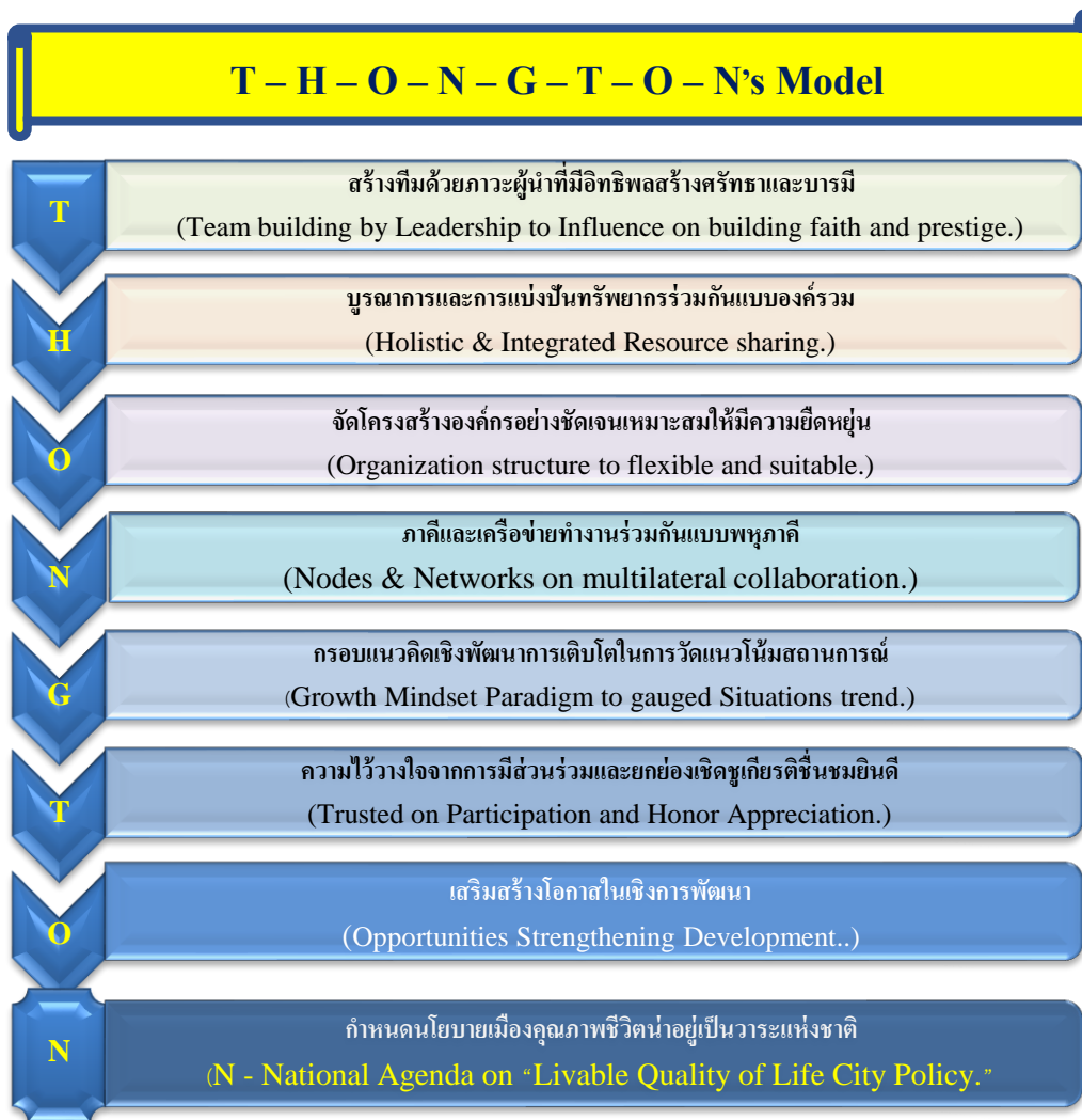
แผนภาพที่ 2 รูปแบบการขับเคลื่อนนโยบายพัฒนาคุณภาพชีวิตประชาชน เขตสุขภาพที่ 4