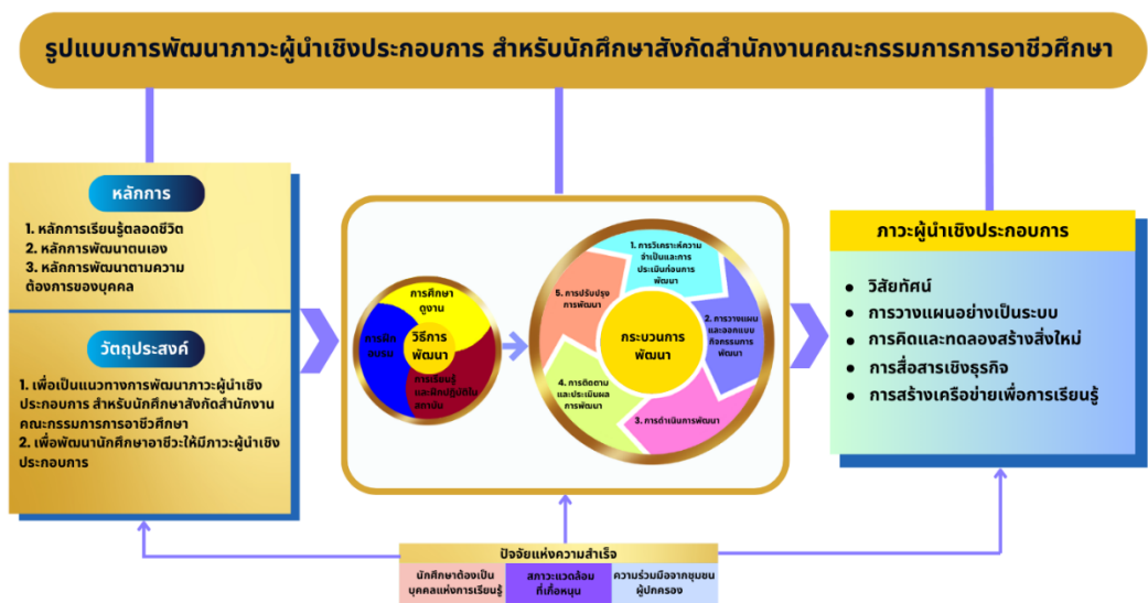
แผนภาพ 2 รูปแบบการพัฒนาภาวะผู้นำเชิงประกอบการ สำหรับนักศึกษา สังกัดสำนักงานคณะกรรมการการอาชีวศึกษา

ผลการสร้างรูปแบบการพัฒนาภาวะผู้นำเชิงประกอบการ สำหรับนักศึกษาสังกัดสำนักงานคณะกรรมการการอาชีวศึกษา ดังแผนภาพ 2