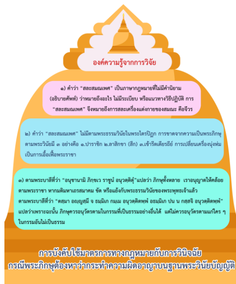
ภาพที่ 1 แสดงองค์ความรู้จากการวิจัย

จากการศึกษาวิจัยเรื่องการบังคับใช้มาตรการทางกฎหมายกับการวินิจฉัยกรณีพระภิกษุต้องหาว่ากระทำความผิดอาญาบนฐานพระวินัยบัญญัติ ผู้วิจัยได้ศึกษาบริบทการบังคับใช้มาตรการทางกฎหมายกับการวินิจฉัยกรณีพระภิกษุต้องหาว่ากระทำความผิดอาญาบนฐานพระวินัยบัญญัติ ปัญหา และอุปสรรคการบังคับใช้มาตรการทางกฎหมายกับการวินิจฉัยกรณีพระภิกษุต้องหาว่ากระทำความผิดอาญาบนฐานพระวินัยบัญญัติ และการศึกษาข้อเสนอแนะจากผู้เชี่ยวชาญที่เป็นผู้ให้ข้อมูลสำคัญเพื่อการวิจัยเกี่ยวกับแนวทางการแก้ไขปัญหา และอุปสรรคการบังคับใช้มาตรการทางกฎหมายกับการวินิจฉัยกรณีพระภิกษุต้องหาว่ากระทำความผิดอาญาบนฐานพระวินัยบัญญัติ สามารถสรุปองค์ความรู้ได้ดังแผนภาพต่อไปนี้