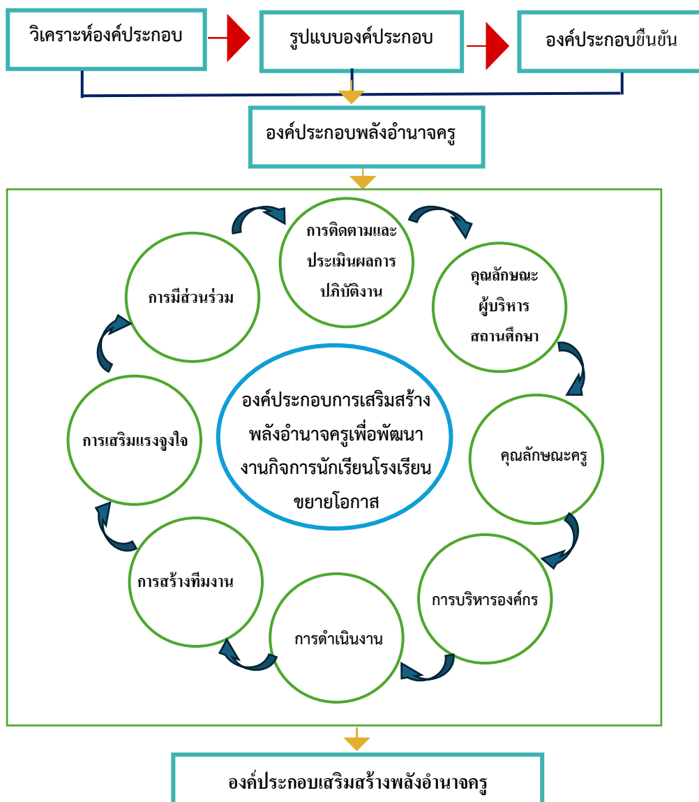
รูปที่ 1 แสดงองค์ประกอบเสริมสร้างพลังอำนาจครูเพื่อพัฒนางานกิจการนักเรียนโรงเรียน ขยายโอกาสในภาคตะวันออกเฉียงเหนือ

องค์ประกอบที่ 5 มีตัวแปรที่อธิบายองค์ประกอบ จำนวน 9 ตัวแปร มีค่าน้ำหนักอยู่ระหว่าง .815-.940 องค์ประกอบที่ 6 มีตัวแปรที่อธิบายองค์ประกอบ จำนวน 9 ตัวแปร มีค่าน้ำหนักอยู่ระหว่าง .651-.944 องค์ประกอบที่ 7 มีตัวแปรที่อธิบายองค์ประกอบ จำนวน 7 ตัวแปร มีค่าน้ำหนักอยู่ระหว่าง .881-.980 องค์ประกอบที่ 8 มีตัวแปรที่อธิบายองค์ประกอบ จำนวน 10 ตัวแปร มีค่าน้ำหนักอยู่ระหว่าง .558-.920 รวมตัวแปรเพื่ออธิบายองค์ประกอบทั้งสิ้น จำนวน 74 ตัวแปร มีค่าน้ำหนักอยู่ระหว่าง .558-.980