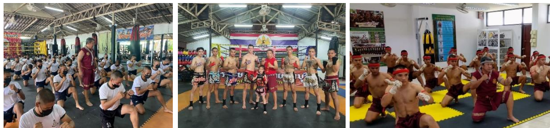
ภาพที่ 16 นักมวยสาธิตวิธีการต่อสู้ในท่ามวยโบราณลพบุรี (อรุณี เจริญทรัพย์ , 2567)