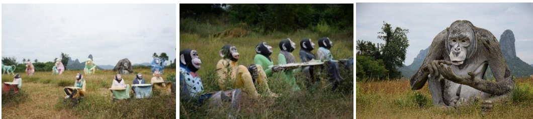
ภาพที่ 5 ภาพประติมากรรมลิงที่บริเวณโรงแรมลพบุรีอินน์รีสอร์ท (อรุณี เจริญทรัพย์, 2566)