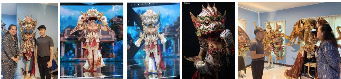
ภาพที่ 6 ภาพชุดหนุมานมวยไทยโดย อิงฟ้า วราหะ มิสแกรนด์ไทยแลนด์ 2022