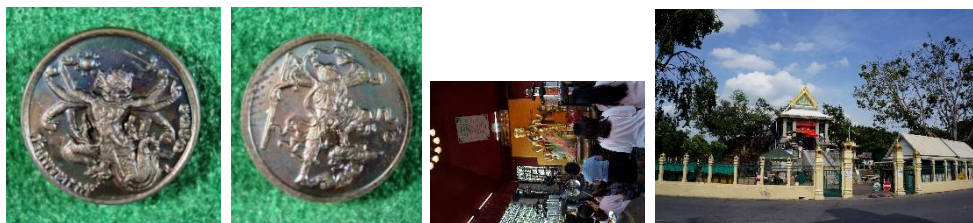
ภาพที่ 12 เหรียญพระนาคปรกเทพหนุมาน 8 กรและเจ้าพ่อแห่งเจีย (อรุณี เจริญทรัพย์, 2566)