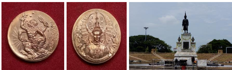
ภาพที่ 10 เหรียญนุมาณาทำหาวเป็นดาวเป็นเดือน (อรุณี เจริญทรัพย์, 2566)