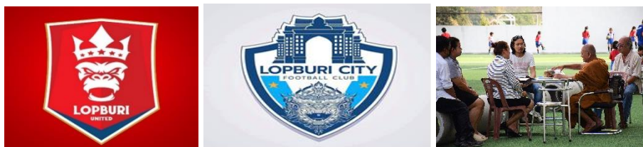
ภาพที่ 11 ตราสัญลักษณ์ประจำสโมสร ลพบุรียูไนเต็ดและสโมสร ลพบุรีซิตี