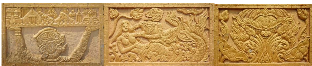
ภาพที่ 14 หนุมานครองเมือง หนุมานเกี่ยวนางสุพรรณมัจฉา หนุมานแทงทศกรรณ (อรุณี เจริญทรัพย์, 2567)