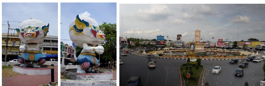
ภาพที่ 2 ภาพหนุมานหัวโต ถือคอบเพลิง ซึ่งเป็นมาสคอตและ สัญลักษณ์งานกีฬาแห่งชาติ ครั้งที่ 21 ที่จัดขึ้นที่เมืองลพบุรีเป็นเจ้าภาพ (อรุณี เจริญทรัพย์, 2566)

หนุมาน ภาพตัวแทนของการแข่งขันงานกีฬาแห่งชาติครั้งที่ 21 ที่จัดขึ้นที่จังหวัดลพบุรี มีการนำมาแสดงเป็นสัญลักษณ์ของงาน ในรูปแบบ "หนุมานหัวโต" ถือคอบเพลิง เพื่อสื่อความหมายว่า เป็นการแข่งขันที่เมืองลิง จากการสัมภาษณ์ผู้ออกแบบ เกิดจากการที่ได้เห็นลิงตั้งแต่สมัยยังเด็ก สัมผัสพบฝูงวานรจนคุ้นเคย แปลกใจในความเป็นอยู่ลิงลพบุรี ที่อาศัยวงเวียนศาลพระกาฬโดยไม่ละทิ้งพื้นที่ ทำให้คิดถึงตำนานเรื่องรามเกียรติ์เกี่ยวกับหนุมานที่ครอบครองดินแดนลพบุรีมาจนถึงปัจจุบัน ดังนั้นลิงลพบุรีน่าจะเป็นลูกหลาน ถึง