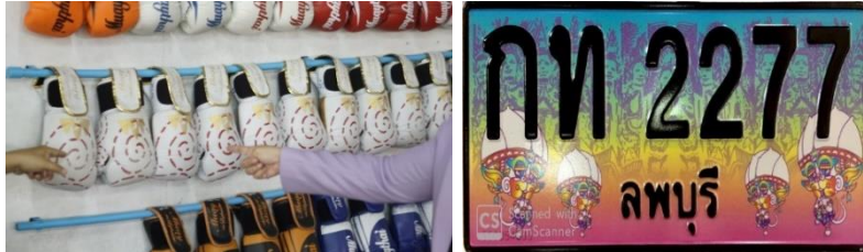
ภาพที่ 16 นวมมวยไทยตราหนุมาน และป้ายทะเบียนรถยนต์หนุมาน (อรุณี เจริญทรัพย์, 2567)

หนุมานถูกใช้เป็นภาพตัวแทนของการค้าขายเชิงพาณิชย์ ในรูปแบบนวมมวยไทยหนุมาน และ กรอบป้ายรถยนต์รูปหนุมานท่าไหว้ จากการศึกษา ผู้วิจัยพบว่า ภายในค่ายมวยไทยในเมืองลพบุรีนั้น มีอุปกรณ์ในการซ้อมมวยต่างๆ ได้คือ นวมมวยไทยซึ่งมีรูปของหนุมานปรากฏอยู่ในนั้น การใช้รูปหนุมานในอุปกรณ์มวยเป็นการสื่อให้เห็นว่า หนุมานเป็นสัญลักษณ์ของการต่อสู้ ซึ่งจะปกป้องผู้คนในการแข่งขันมวย เพื่อไม่ให้ได้รับการบาดเจ็บมาก และนอกจากนี้ การนำรูปหนุมานมาเป็นจุดขายในครั้งนี้ ย่อมเป็นพลังอำนาจทางเศรษฐกิจในการ สร้างอำนาจขายได้อีกทีหนึ่ง ในอีกบริบทหนึ่ง พบว่า มีการใช้ป้ายทะเบียนมงคลจังหวัดลพบุรีนั้นเป็นรูปหนุมานยืนไหว้ 4 ตน ประกอบด้านซ้ายและขวาอย่างละ 2 ตน ออกแบบโดยอาจารย์ อาทิตย์ ทวีคุณ ด้านหลังเป็นรูปลายปูนปั้นวัดพระศรีรัตนมหาธาตุ สื่อความหมายถึงสัญลักษณ์แห่งเมืองหนุมาน มีรูปแบบที่สวยงามและเปี่ยมไปด้วยมงคล สร้างขึ้นเป็นรูปหนุมานยกมือวันทา มีอนุภาพด้านเมตตามหานิยมเป็นเลิศ ให้ผลด้านความเจริญก้าวหน้าในหน้าที่การงาน หนุนดวงชะตาไม่ให้เกิดทุกข์ ประสบความสำเร็จต่างๆตามที่หวัง หรือด้านแคล้วคลาด ป้องกันภัย