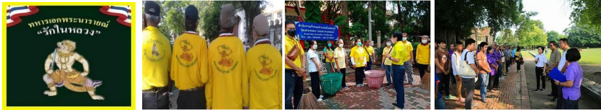
ภาพที่ 9 ภาพทีมงานของกลุ่ม ทหารเอกพระนารายณ์ ใส่เสื้อที่มีสัญลักษณ์เป็นรูปหนุมานเชิงูธง กำลังชุมนุมกันทำกิจกรรมทางการเมืองภาคประชาชน