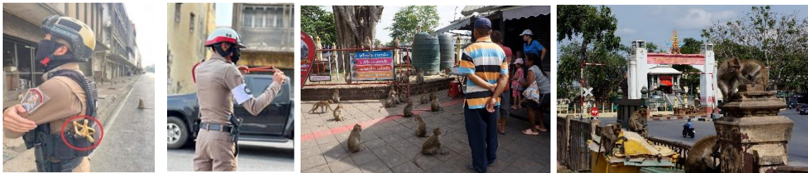
ภาพที่ 15 ตำรวจสถานีตำรวจภูธรท่าหินปฏิบัติการกิจป้องกันภัยคุกคามจากลิง