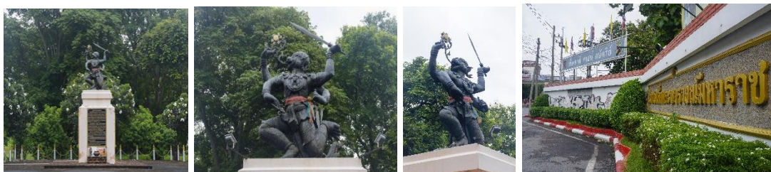
ภาพที่ 8 ประติมากรรมหนุมานสีกกรท่าหาวเป็นดาวเดือน

ประดิษฐานอยู่ข้างหน้าหน่วยบัญชาการสงครามพิเศษ จังหวัดลพบุรี (อรุณี เจริญทรัพย์, 2566)