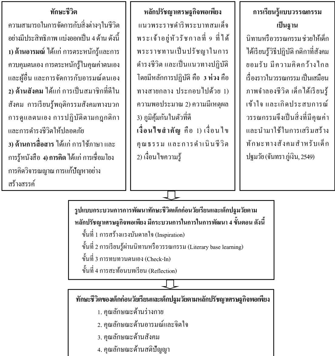
ภาพที่ 1 กรอบแนวคิดการวิจัย