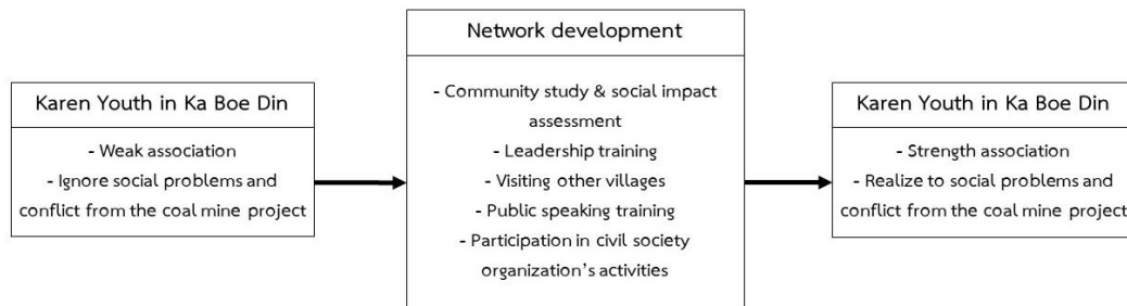
Figure 2. Network development of Karen youth in Ka Boe Din village

สนับสนุนให้เกิดการรวมกลุ่มของเยาวชนบ้านกะเบอะดินในรูปแบบของเครือข่ายทางสังคมทำให้กลุ่มเยาวชนเกิดความสนิทสนมกัน เกิดการไว้วางใจเชื่อใจกันในการทำงาน เกิดการประสานงานและแบ่งงานกันทำอย่างมีประสิทธิภาพ นำไปสู่การพัฒนาตนเองและพัฒนาเครือข่ายเยาวชนที่เข้มแข็งในระยะเวลาอันสั้นที่สุด (Figure 2)