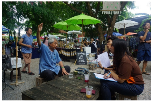
Figure 2. Community environment