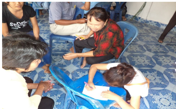
Figure 2 Transfer of knowledge by local scholars and woven reed mats

3. การสร้างความเข้มแข็งให้กับชุมชน พบว่าชาวบ้านคำไผ่เดิมมีการทอเสื่อกกไว้เพื่อใช้งานในครัวเรือน หรือเป็นของฝาก งานบุญประเพณีของชุมชน และปัจจุบันยังสามารถเป็นสินค้าที่สามารถสร้างรายได้ให้กับครัวเรือนหรือคนในชุมชนได้เป็นอย่างดี คนในชุมชนมีความรักและเกิดความสามัคคีและช่วยเหลือซึ่งกันและกันมากยิ่งขึ้นมีการแลกเปลี่ยนเรียนรู้ภูมิปัญญาท้องถิ่นระหว่างรุ่นสู่รุ่น (ภาพที่ 4 และ 5)