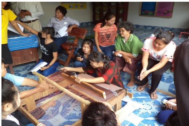
Figure 3 Demonstration of participatory test reed mats