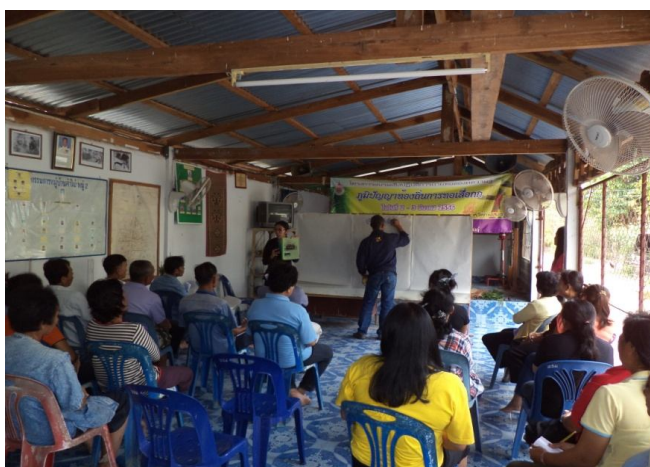
Figure 5 The knowledge and local wisdom weaving reed mats