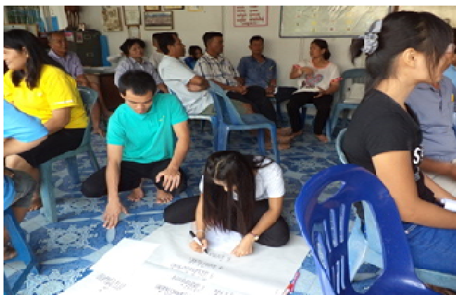
Figure 4 Brainstorming to gather knowledge of weaving reed mats