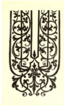
การผูกลายแบบตะวันตก