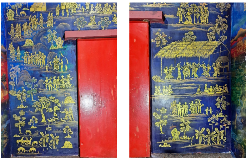
ภาพที่ 2 การสร้างสรรค์งานจิตรกรรมฝาผนังอัตลักษณ์ลายคำประยุกต์ล้านนา หลังจากนั้น ทีมวิจัยได้สร้างสรรค์การออกแบบและสร้างสรรค์ศิลปะลายคำล้าน

ที่มวิจัยได้มีการออกแบบและทำการสร้างสรรค์งานจิตรกรรมฝาผนังอัตลักษณ์ลายคำประยุกต์โดยเทคนิคฉลุลายบนพื้นผนังศาสนสถานในบางส่วน เพื่อเป็นแหล่งเรียนรู้ทางศิลปกรรมล้านนาบูรณาการกับการเรียนการสอน