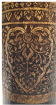
ลายคำเชิงเสาวิหาร

นาประยุกต์ เชิงรูปธรรม โดยการทำภาพร่างสเก็ตต้นแบบ และแกะแบบลายคำดั้งเดิมจาก จิตรกรรมฝาผนังหรือจิตรกรรมลายคำจากเสาศระวิหาร อุโบสถ แล้วนำมาปรับประยุกต์ ให้เป็นแนวทางในการสร้างสรรค์ผลงานวิจัยรูปแบบใหม่ ที่บูรณาการกับรายวิชาการ จัดการมรดกสถาปัตยกรรมและชุมชนที่ผู้วิจัยได้เป็นผู้บรรยาย เป็นต้นแบบที่สร้างสรรค์ มาจากลายคำบนฝาผนังและเสาศาตามศาสนสถาน นำลายคำมาปรับประยุกต์ให้เข้ากับงาน สถาปัตยกรรมแบบใหม่ ดังภาพ