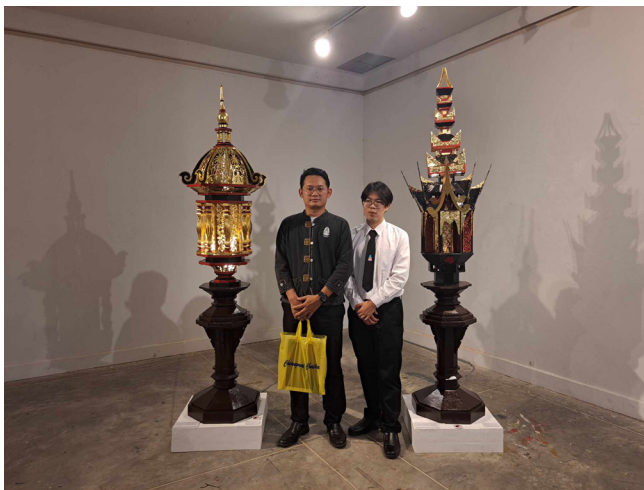
ภาพที่ 4 การสร้างสรรค์ศิลปะลายคำล้านนาประยุกต์เชิงรูปธรรม (โคมไฟประดับลายคำประยุกต์ล้านนา)