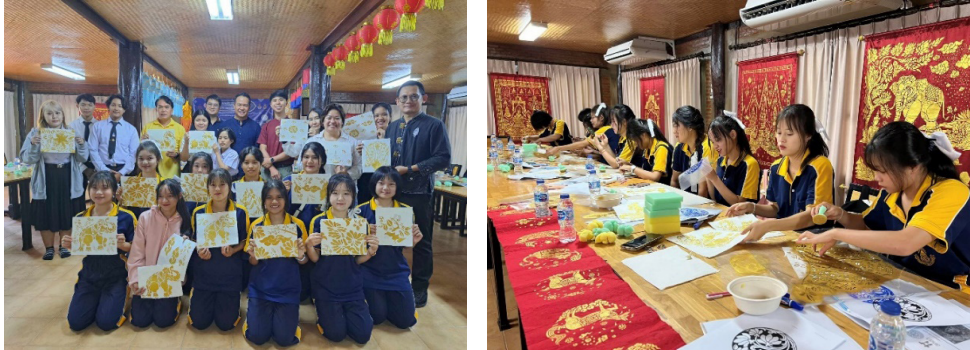
ภาพที่ 5 กิจกรรมที่สร้างการพัฒนาทักษะกำลังคน

5. กิจกรรมการเผยแพร่ผลงานที่ได้จากงานวิจัยสู่สาธารณชนในด้านการวิจัยและสร้างสรรค์ เพื่อเผยแพร่กิจกรรมที่สร้างการพัฒนาทักษะกำลังคน ทางสื่อออนไลน์