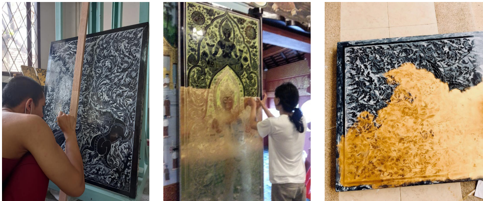
ภาพที่ 1 ลายคำเทคนิคลายคำน้ำรด การเขียนลายคำน้ำรด

จากกระบวนการข้างบนที่ได้กล่าวมาแล้วเป็นการสร้างสรรค์แบบโบราณ หรือแบบเก่านั่นเอง แต่ในงานวิจัยนี้จะเป็นการออกแบบและสร้างสรรค์งานจิตรกรรมฝาผนังอัตลักษณ์ลายคำประยุกต์ในสมัยปัจจุบัน หรือร่วมสมัยให้มีมิติการมองที่สดใสนั่น