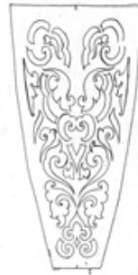
ลวดลายที่ใช้ในการสร้างสรรค์