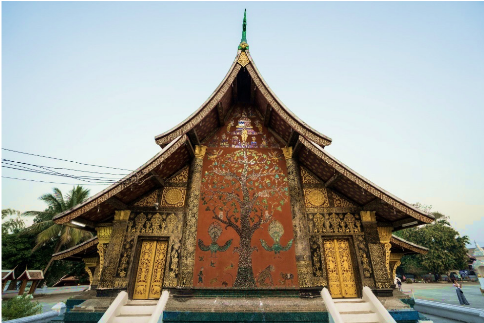
รูปที่ 2 ภาพต้นทอง จิตรกรรมกระเจกสี ทางด้านหลังของสิมวัดเชียงทอง

2) องค์ประกอบภาพจิตรกรรม ลายฟอกคำ และรูปแต้มแก้วสี ที่แสดงออกในทางศิลปะ (Elements of Art) ของสิม วัดเชียงทอง มีดังนี้ คือ