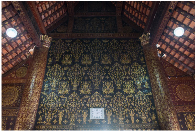
รูปที่ 1 ผนังทางด้านทิศเหนือ บนต้นกัลปพฤกษ์ นกหัสดีลิงค์

เรื่องพุทธประวัติตอนปราบมาร เรื่องของพระสุธนและนางมโนราห์ ส่วนด้านในเป็นเรื่องพระเวสสันดร เรื่องวิหุรทบัณฑิตเทศนาให้พระอินทร์ฟัง เรื่องสังข์ทองตอนรจนาเลือกคู่และสังข์ทองเนรมิตกระท่อมให้กลายเป็นพระราชวัง นิทานชาดกเรื่องพระมหาชนกและสุวรรณสาม ลาย “พอกคำ” ที่พบนี้แทบจะเหมือนกับภาพการลงรักปิดทองเรื่องพุทธประวัติที่วิหารวัดปราสาทของเมืองเชียงใหม่ ยกเว้นผนังทางด้านทิศใต้ซึ่งเป็นจิตรกรรมติดแก้วสีเรื่อง เรื่องราวของจิตรกรรมจะเป็นเรื่องทศชาติชาดก และปัญญาชาดก