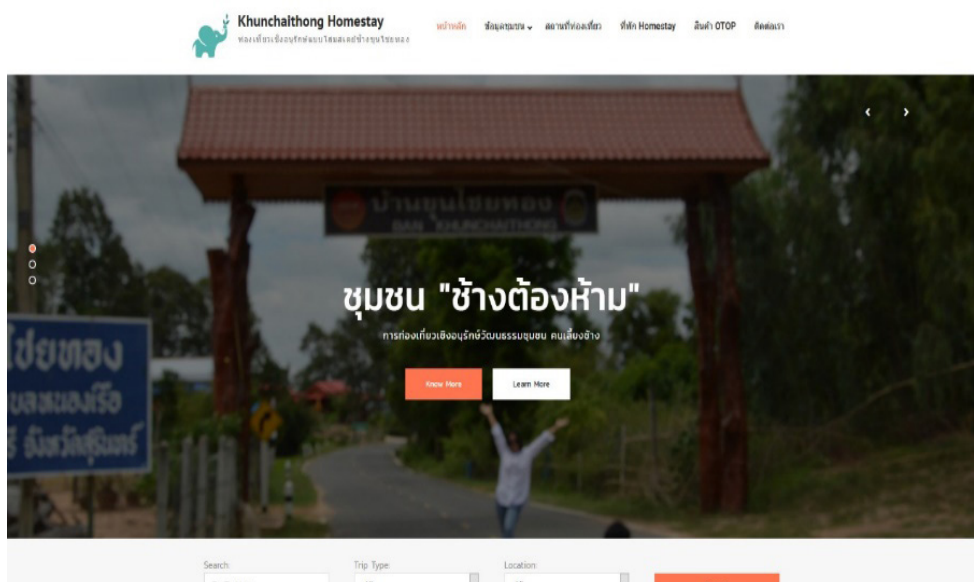
รูปที่ 1 เว็บไซต์การท่องเที่ยวหมู่บ้านขุนไชยทอง

3. ผลจากการสร้างและพัฒนานวัตกรรมการส่งเสริมการท่องเที่ยวของคุณผู้วิจัยจึงสามารถนำมาเป็นข้อมูลสำหรับการออกแบบนวัตกรรมส่งเสริมการท่องเที่ยว ในรูปแบบของเว็บไซต์การท่องเที่ยวของหมู่บ้าน คือ http://khunchaithong.srru.ac.th โดยมีภาพตัวอย่างดังนี้