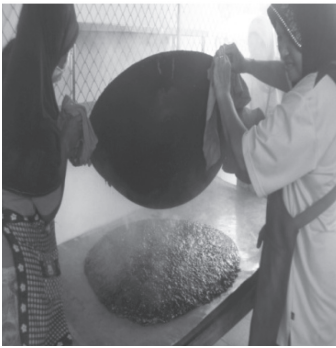
ภาพประกอบ 6 กาแพที่ควมเสร็จ เทลงบนแผ่นอะลูมิเนียม

4. หลังจากที่ได้ควมเมล็ดกาแพที่เข้ากันกับน้ำตาลที่มีลักษณะเหนียวหนืดแล้ว ก็นำมาเทลงบนแผ่นอะลูมิเนียมที่มีลักษณะเป็นรูปสี่เหลี่ยมผืนผ้า ยาวประมาณ 2 เมตร กว้างประมาณ 80 เซนติเมตร แล้วกระจายให้ทั่วแผ่น ไม่ให้หนามากนัก ก็จะได้เมล็ดกาแพแผ่นหนืดแผ่นใหญ่ 1 แผ่น จากนั้นก็ทิ้งไว้ให้เย็น ภูมิปัญญาที่สอดแทรกในวิธีการขั้นตอนนี้คือ ในขณะที่เทกาแพลงบนแผ่นอะลูมิเนียมนั้น ให้นำตะหลิวเหล็กตีลงบนแผ่นกาแพให้แน่น แล้วยกตะหลิวขึ้นจะมียางกาแพติดขึ้นมา เหมือนใยแมงมุม ซึ่งจะทำการต้อนนำกาแพไปชงจะมีน้ำกาแพออกมาเป็นจำนวนมากและทำให้รสชาติกลมกล่อม