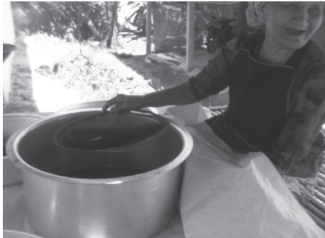
ภาพประกอบ 10 การร่อนกาแฟ โดยใช้ดีหริ่ง ที่มา : ถ่ายเมื่อวันที่ 20 กันยายน 2557

7. เมื่อได้ผงกาแฟที่ละเอียดแล้ว ก็นำไปบรรจุถุงฟรอยด์ สีเงิน เนื่องจากเป็นถุงที่อากาศเข้าไปได้ยาก ชาวบ้านเรียก “ป้องกันกาแฟเข้าลม” ปริมาณที่บรรจุก็จะมี 2 ขนาดคือ ครึ่งกิโลกรัม และ 1 กิโลกรัม จากนั้นก็นำถุงที่ได้บรรจุลงในบรรจุภัณฑ์ที่สวยงามอีกครั้งหนึ่ง มีลักษณะเป็นกระดาษแข็งสีน้ำตาล สามารถย่อยสลายได้ง่าย ภายในบรรจุภัณฑ์ก็จะมีอุปกรณ์การชง เป็นผ้าขาวด้ายดิบเย็บกับด้ามลวดที่มีความแข็งแรง ซึ่งชาวบ้านได้ตัดเย็บเองพร้อมวิธีการชงที่ระบุไว้ข้างบรรจุภัณฑ์ เมื่อบรรจุเสร็จแล้วก็นำขายส่งตามพื้นที่ที่ได้มีการติดต่อประสานงานไว้ เช่น สนามบินนานาชาติกระบี่ ห้างสรรพสินค้าเทศบาลใกล้เคียง และพื้นที่ต่างจังหวัดต่อไป