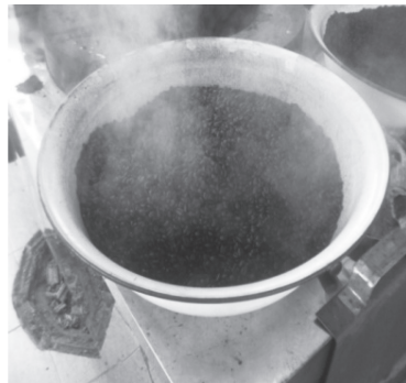
ภาพประกอบ 3 ลักษณะกาแฟที่คั่วเสร็จแล้ว