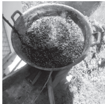
ภาพประกอบ 4 การเคี้ยวน้ำตาล