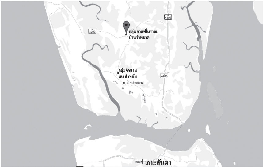
ภาพประกอบ 1: แสดงแผนที่ชุมชนบ้านรำหามาด

ลดปัญหาการว่างงานของสตรีสูงวัย ซึ่งจะนำไปสู่ชุมชนเข้มแข็งและพึ่งพาตนเองได้ตามหลักปรัชญาของเศรษฐกิจพอเพียง