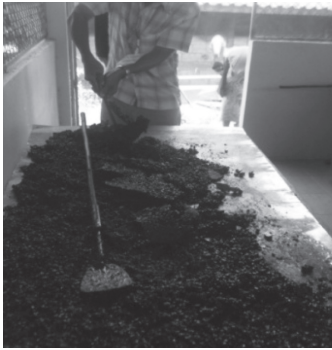
ภาพประกอบ 8 แผ่นกาแพที่เคาะได้ พร้อมนำไปตำ

ออกจากครกในขณะที่ตำ สากทำจากไม้เช่นกัน ลักษณะคล้ายนาฬิกาทราย ผู้ที่ตำต้องจับตรงกลางของสาก สามารถตำได้ 2 หัว ซึ่งกระบวนการขั้นตอนนี้ นักท่องเที่ยวที่มาเยี่ยมชมจะให้ความสนใจและเข้ามามีส่วนร่วมมากกว่าขั้นตอนอื่นๆ เพราะคิดว่าสามารถทำได้ง่ายเทคนิคในการตำก็มีหลายแบบ เช่น ตำ 2 สาก ตำ 3 สาก เป็นต้น ตำ 2 สาก หมายถึง มีคนตำ 2 คน 2 สาก ใน 1 ครก ซึ่งต้องจับจังหวะผลักดันตำ ส่วนการตำ 3 สากนั้นจะยากกว่าการตำ 2 สาก คือมีคน 3 คน 3 สาก สลับกันตำ จับจังหวะให้ถูกต้อง