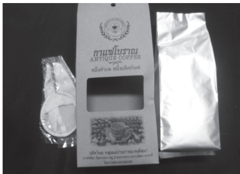
ภาพประกอบ 11 ถุงชงและลักษณะถุงบรรจุกาแฟ ที่มา : http://164.115.23.30/CDDReport/rpRegisterProductInfo.aspx?id=81030000616223

7. เมื่อได้ผงกาแฟที่ละเอียดแล้ว ก็นำไปบรรจุถุงฟรอยด์ สีเงิน เนื่องจากเป็นถุงที่อากาศเข้าไปได้ยาก ชาวบ้านเรียก “ป้องกันกาแฟเข้าลม” ปริมาณที่บรรจุก็จะมี 2 ขนาดคือ ครึ่งกิโลกรัม และ 1 กิโลกรัม จากนั้นก็นำถุงที่ได้บรรจุลงในบรรจุภัณฑ์ที่สวยงามอีกครั้งหนึ่ง มีลักษณะเป็นกระดาษแข็งสีน้ำตาล สามารถย่อยสลายได้ง่าย ภายในบรรจุภัณฑ์ก็จะมีอุปกรณ์การชง เป็นผ้าขาวด้ายดิบเย็บกับด้ามลวดที่มีความแข็งแรง ซึ่งชาวบ้านได้ตัดเย็บเองพร้อมวิธีการชงที่ระบุไว้ข้างบรรจุภัณฑ์ เมื่อบรรจุเสร็จแล้วก็นำขายส่งตามพื้นที่ที่ได้มีการติดต่อประสานงานไว้ เช่น สนามบินนานาชาติกระบี่ ห้างสรรพสินค้าเทศบาลใกล้เคียง และพื้นที่ต่างจังหวัดต่อไป