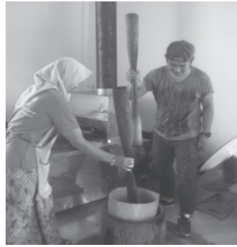
ภาพประกอบ 9 การตำกาแพ 2 สาก ที่มา: ถ่ายเมื่อวันที่ 20 กันยายน 2557

6. เมื่อตำจนเป็นผงแล้ว ก็นำไปร่อน อุปกรณ์ที่ใช้ในการร่อน ชาวบ้านจะตัดเย็บเอง ชาวบ้านเรียกว่า “สิหริง” มีลักษณะเป็นตาข่ายสีน้ำเงิน ชาวบ้านตัดเย็บให้เป็นแบบรูปวงกลม จากการลองผิดลองถูกแล้ว ปรากฏว่า สิหริง สามารถร่อนได้ดีที่สุด รูด่าข่ายของสิหริงเหมาะสมกับกาแพที่บดเสร็จแล้ว เมื่อนำกาแพมาร่อน เนื้อกาแพบางส่วนที่ยังไม่ละเอียด ไม่สามารถผ่านรูสิหริงได้ ก็จะนำกลับไปตำใหม่