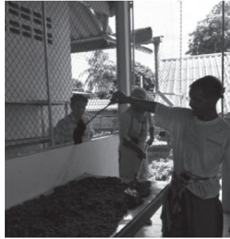
ภาพประกอบ 7 ยางกาแพ เหมือนใยแมงมุม

5. เมื่อเมล็ดกาแพแผ่นหนืดเริ่มเย็นและแข็งตัว ก็ใช้ตะหลิวเหล็กเคาะออกมา ให้เป็นแผ่นเล็ก ๆ พร้อมสำหรับการนำไปตำในครกและสากที่ทำจากไม้ซึ่งมีลักษณะแข็งแรงมาก การตำต้องใช้จั้งหวะและความแม่นยำเพื่อให้ได้กาแพที่ละเอียดลักษณะของครกเป็นครกที่ทำจากไม้ ก่อนตำจะต้องนำแผ่นอะลูมิเนียมตัดเป็นแผ่นยาว แล้วมัดวนให้พอดีกับปากครก ความสูงให้สูงกว่าครก เพื่อเป็นการป้องกันไม่ให้แผ่นกาแพกระเด็น