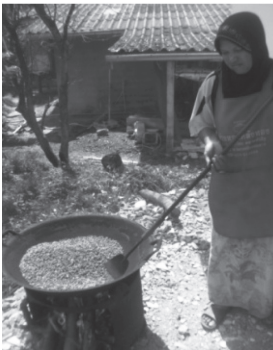
ภาพประกอบ 2 การคั่วกาแฟ

2. นำเมล็ดกาแฟที่ได้มาคั่วในกระทะ ปริมาณการคั่วแต่ละครั้งจะอยู่ที่ 5 กิโลกรัม โดยไฟที่ใช้ในการคั่วใช้ไฟแรง ไม้ฟืนเป็นไม้ยางพาราที่หาได้เองในหมู่บ้าน อุปกรณ์ที่ใช้ในการคั่วจะเป็นแท่งเหล็กด้ามยาวประมาณ 1.5 เมตร คั่วไปเรื่อยๆ ประมาณ 40 นาที เมื่อเมล็ดกาแฟเริ่มเปลี่ยนสีเป็นสีดำ ก็ตักกาแฟใส่ในกะละมังอะลูมิเนียมทิ้งไว้ให้เย็น เมล็ดกาแฟจะมีลักษณะใหญ่ขึ้นกว่าเดิม ส่งกลิ่นหอม ชวนให้ลิ้มลอง