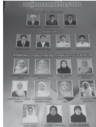
ภาพประกอบ 13 โครงสร้างของกลุ่มกาแฟโบราณ ถ่ายเมื่อวันที่ 20 กันยายน 2557