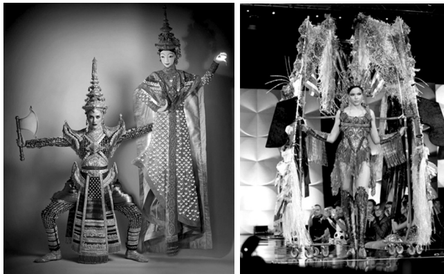
ภาพที่ 2 นิทานปรัมปราที่ถูกนำมาสื่อสารความเป็นไทยจากการออกแบบของแฟนคลับ

3. นิทานปรัมปรา ซึ่งเป็นเรื่องเล่าที่แฟนคลับเสนอเป็นแนวคิดในการออกแบบชุดประจำชาติต่อผู้ผลิตนางงาม เป็นการแปลงโฉมนิทานปรัมปรา เรื่องเล่าที่มีลักษณะเป็นนามธรรม จับต้องไม่ได้ (intangible) มองไม่เห็น (invisible) ให้สามารถมองเห็น (visible) ได้ผ่านการออกแบบชุดที่แสดงอัตลักษณ์ของชาติเพื่อใช้ในรอบการประกวดของรายการนางงามจักรวาล (Miss Universe) เช่น ชุดเมฆาลอแก้วของมิสยูนิเวิร์สไทยแลนด์ปี ค.ศ. 2017 และชุดผีตาโขน ของมิสยูนิเวิร์สไทยแลนด์ปี ค.ศ. 2019