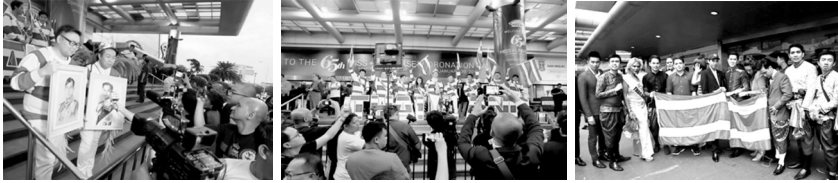
ภาพที่ 1 การสื่อสารอัตลักษณ์ความเป็นชาติ ณ กรุงมะนิลา ม.ค. 60 ของแฟนคลับนางงาม

2. เสียงกรีดร้องเชียร์ “THAILAND” บ่งบอกความชื่นชม การให้กำลังใจ และความรักที่มีต่อนางงามผู้เป็นตัวแทนของชาติ ซึ่งอาจวิเคราะห์ได้ว่าเป็นลักษณะการมีชื่อเรียกเฉพาะกลุ่ม (collective proper name) คือ “THAILAND”