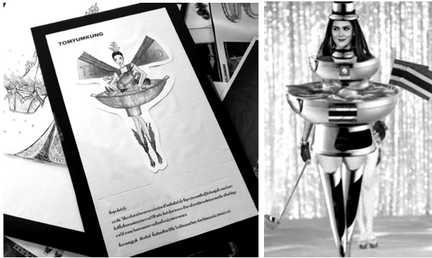
ภาพที่ 3 วัฒนธรรมอาหารที่ถูกนำมาสื่อสารอัตลักษณ์ความเป็นไทยจากการออกแบบของแฟนคลับ

4. วัฒนธรรมอาหารไทยที่แฟนคลับเสนอเป็นแนวคิดในการออกแบบชุดประจำชาติต่อผู้ผลิตนางงาม เช่น ชุดต้มยำกุ้ง ซึ่งมีการออกแบบ ส่งเข้าประกวดหรือติดต่อเพื่อสื่อสารภายในกลุ่มแฟนคลับ ซึ่งอาจวิเคราะห์ได้ว่าวัฒนธรรมอาหารที่ถูกนำมาใช้เป็นหนึ่งในสัญลักษณ์แสดงความเป็นไทย (Thainess) ของกลุ่มแฟนคลับเป็นการแปลงโฉมวัฒนธรรมอาหารเข้าข่ายเป็นอัตลักษณ์ที่จับต้องไม่ได้ (intangible identity) ลักษณะที่สิ่งประดิษฐ์ทางวัฒนธรรมที่มีลักษณะเฉพาะ (cultural artefacts of a particular kind)