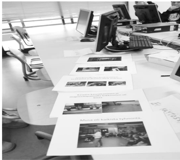
ผลงานของนักเรียนจากกิจกรรมประเมินการสอนของครู