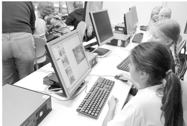
นักเรียนช่วยกันคัดเลือกรูปภาพกิจกรรมการที่นักเรียนชื่นชอบ

นักเรียนเพื่อนำไปใช้ในการปรับปรุงหรือพัฒนาการเรียนการสอนได้เป็นอย่างดีดังผลวิจัยที่ได้กล่าวแล้วข้างต้น