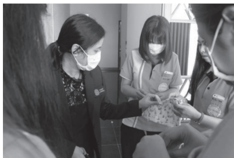
ภาพ 3 ผู้สอนทำหน้าที่แนะนำ อธิบายภาพรวมของเนื้อหาวิชา กำหนดวิธีการนำเสนอถ่ายทอดความรู้ และคอยช่วยเหลือ ให้กำลังใจเมื่อผู้เรียนพบปัญหา