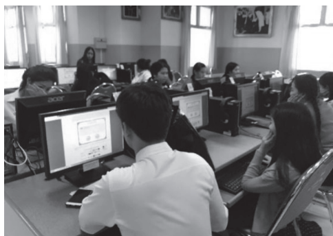
ภาพ 4 ผู้เรียนศึกษาหาความรู้เพิ่มเติมด้วยตนเองนอกห้องเรียน วางแผน และเตรียมถ่ายทอดความรู้ตาม หัวข้อที่ผู้สอนกำหนดนอกเหนือเวลาเรียน