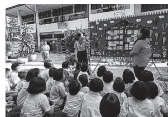
ภาพ 5-7 ผู้เรียนนำเสนอ และให้ความรู้ตามหัวข้อที่กำหนดด้วยวิธีที่หลากหลาย เช่น การสาธิต การแสดงบทบาทสมมติ และการบรรยายประกอบสื่อ โดยผู้เรียนได้ฝึกถ่ายทอดความรู้แก่กลุ่มคนที่แตกต่างกัน ได้แก่ เพื่อนในชั้นเรียน บุคคลภายในมหาวิทยาลัย และบุคคลภายนอกมหาวิทยาลัย