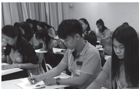
ภาพ 8 ผู้เรียนและผู้สอนสรุปการเรียนรู้ร่วมกันทั้งแบบกลุ่มใหญ่ กลุ่มย่อย และการบันทึกสะท้อนการเรียนรู้ส่วนบุคคล