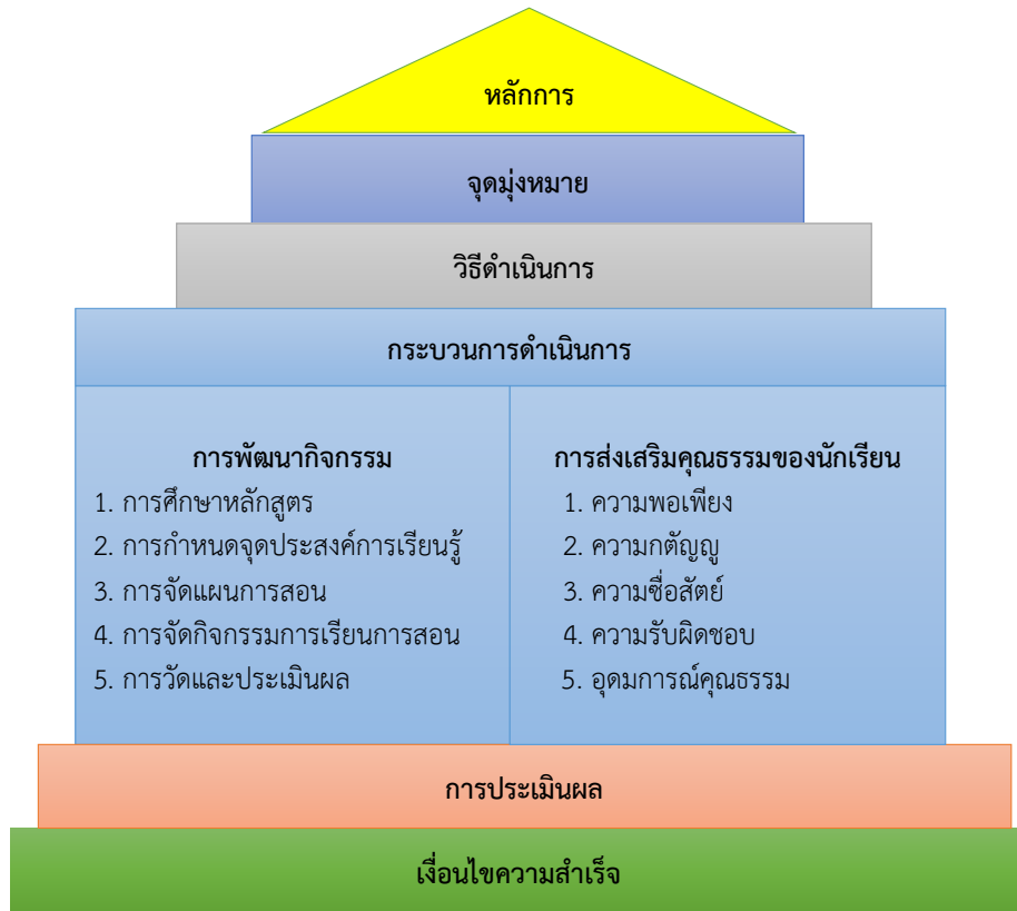
ภาพที่ 1 รูปแบบการพัฒนากิจกรรมการส่งเสริมคุณธรรมของนักเรียนสำหรับโรงเรียนสังกัดสำนักงานเขตพื้นที่การศึกษาประถมศึกษา

รูปแบบการพัฒนากิจกรรมการส่งเสริมคุณธรรมของนักเรียนสำหรับโรงเรียนสังกัดสำนักงานเขตพื้นที่การศึกษาประถมศึกษา เป็นกระบวนการพัฒนากิจกรรมการส่งเสริมคุณธรรมของนักเรียนระดับประถมศึกษา ประกอบด้วยองค์ประกอบหลัก 6 ประการ ได้แก่ หลักการ จุดมุ่งหมาย วิธีดำเนินการ กระบวนการดำเนินการ การประเมินผล และเงื่อนไขความสำเร็จ ดังในภาพที่ 1