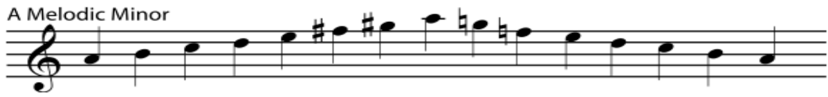
ภาพที่ 4 บันไดเสียงไมเนอร์แบบเมโลดิก

3) โครงสร้างขั้นคู่ ชุดการสอนที่ 3 เรื่องโครงสร้างขั้นคู่ มีความรู้ความเข้าใจเกี่ยวกับ ขั้นคู่ เมื่อนักเรียนศึกษาเกี่ยวกับความรู้ทั่วไปเกี่ยวกับ ขั้นคู่จะสามารถอ่าน เขียน ร้อง และบรรเลงสากลตาม เครื่องหมายและสัญลักษณ์ทางดนตรีได้อย่างถูกต้อง