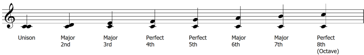
ภาพที่ 5 ขั้นคู่ทั้งหมดใน C เมเจอร์

โดยมีตัวอย่างขั้นคู่ทั้งหมดใน C เมเจอร์ ดังภาพที่ 5