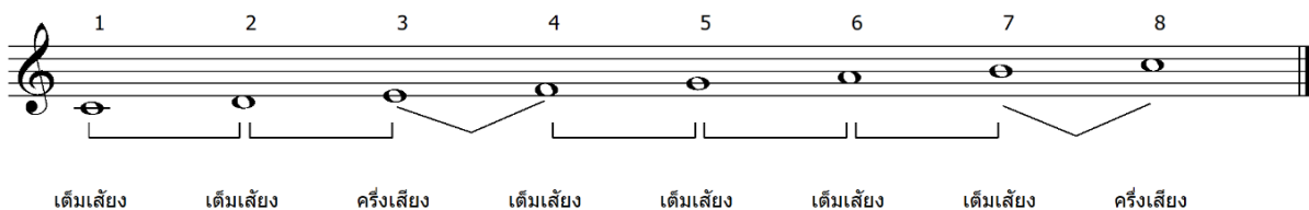
ภาพที่ 1 ตัวอย่างที่โครงสร้างของบันไดเสียงเมเจอร์

1) โครงสร้างบันไดเสียงเมเจอร์ ผู้วิจัยได้กำหนดเนื้อหาชุดการสอนที่ 1 เรื่องโครงสร้างบันไดเสียงเมเจอร์ มีความรู้ความเข้าใจเกี่ยวกับโครงสร้างบันไดเสียงเมเจอร์ เมื่อนักเรียนศึกษาเกี่ยวกับความรู้ทั่วไปเกี่ยวกับโครงสร้างบันไดเสียงเมเจอร์ จะสามารถอ่าน เขียน ร้อง และบรรเลงสากลตามเครื่องหมายและสัญลักษณ์ทางดนตรีได้อย่างถูกต้อง ดังในภาพที่ 1