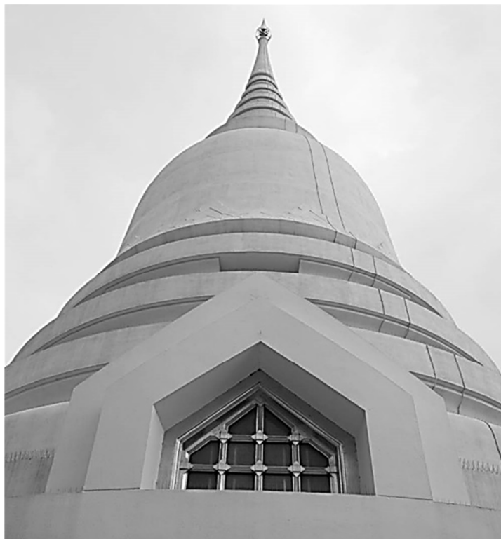
ภาพลักษณะองค์เจดีย์เป็นทรงกลม องค์ระฆังคว่ำ ทำด้วยวัสดุคอนกรีตไม่ตกแต่งลวดลาย เพื่อให้เห็นสัจจะวัสดุที่แท้จริง