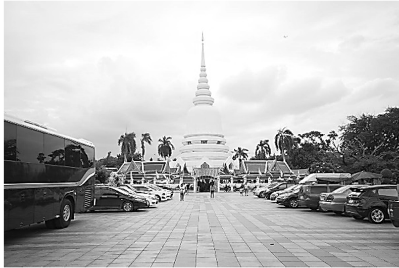
ภาพทางเข้าวัดพระศรีมหาธาตุวรมหาวิหาร จากถนนพหลโยธินแสดงให้เห็นเป็นเจดีย์ประธานตรงกลางชัดเจน