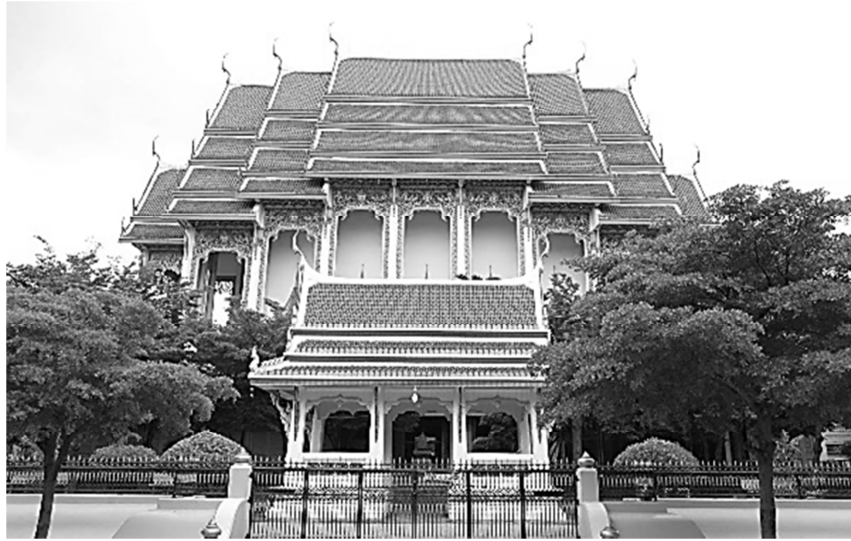
ภาพด้านข้างของอุโบสถจะเห็นรูปทรงหลังคาของเรือนประธานที่ยกสูงกว่า และมีมุขเด็จแบบมุขลด เพื่อทำระดับหลังคาให้ต่ำลงกว่าปกติ