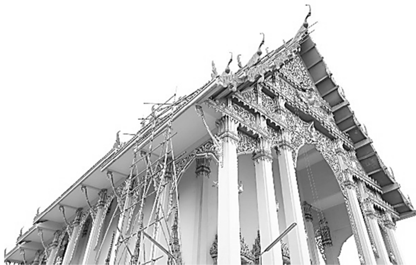
ภาพด้านหน้าของอุโบสถวัดบางบัว

ทรงคฤห์ แต่ทำเป็นเฉลียงแบบมุขลดซึ่งมีหลังคา ลดลงที่ด้านหน้าและด้านหลังเพื่อคลุมส่วนที่เป็นเฉลียงลงมาอีก ๑ ระดับทำให้เฉลียงส่วนด้านล่างเป็นมุขโถงเกิดขึ้น ตัวอุโบสถทาสีชมพู เพื่อเป็นการสร้างถวายให้แก่พระบาทสมเด็จพระปรมินทรมหาภูมิพลอดุลยเดช มหิตลาธิเบศรรามาธิบดี จักรีนฤพดินทร สยามินทราธิราช บรมนาถบพิตร (พระครูพิสิฐวิหารการ, ๒๕๖๐) ดังแสดงในภาพ