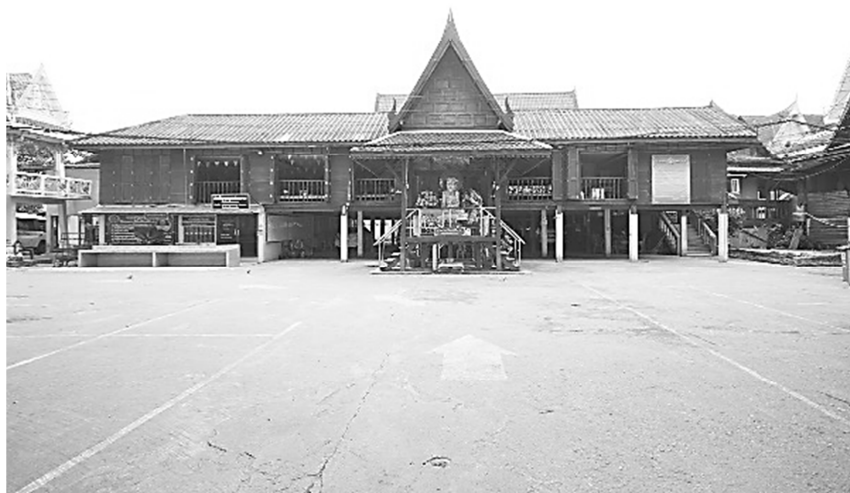
ภาพด้านหน้าจากบริเวณลานจอดรถมองเข้าสู่ศาลาการเปรียญวัดไตรรัตนาราม

กันทั้ง ๔ ด้านแต่จะทำเป็นราวกันตก โดยมีความสูงประมาณ ๘๐ เซนติเมตรซึ่งจะเน้นถึงความเรียบง่ายและประหยัด ถึงแม้ว่าอาคารจะมีหลังคาคลุมโดยรอบ แต่เพื่อเป็นการป้องกันแดดและฝนจึงจัดทำให้มีลักษณะของหน้าต่างบานเพี้ยมโดยรอบอาคาร เพื่อใช้ในการป้องกันแดดและฝนในการเข้าสู่ตัวอาคาร ซึ่งจะต่างกับศาลาการเปรียญที่วัดอื่นที่มีลักษณะการทำแบบ “ฝาพับเขย” ในการปิดตัวอาคาร