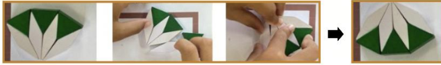
Figure 2. Students' mental rotation using pattern blocks to create a lotus flower shape.

3) การปรับทิศทางเชิงพื้นที่ (Spatial Orientation) จากการวิเคราะห์ข้อมูลพบว่า นักเรียนมีพัฒนาการด้านการปรับทิศทางเชิงพื้นที่อย่างชัดเจน โดยสามารถปรับเปลี่ยนทิศทางของบล็อกเพื่อให้สอดคล้องกับพื้นที่และรูปแบบที่มีอยู่จำกัดได้อย่างเหมาะสม นักเรียนสามารถวางบล็อกในทิศทางที่หลากหลายและถูกต้องตามเงื่อนไขของโจทย์ที่กำหนด การปรับทิศทางเชิงพื้นที่นี้ไม่เพียงแต่แสดงถึงความยืดหยุ่นทางความคิด แต่ยังสะท้อนถึงความเข้าใจในความสัมพันธ์ระหว่างบล็อก รูปร่าง และพื้นที่ที่ต้องใช้งาน