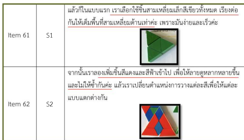
Figure 1. Students' arrangement of pattern blocks demonstrating spatial visualization ability.

1) การมองเห็นเชิงพื้นที่ (Spatial Visualization) จากการวิเคราะห์ข้อมูลพบว่า นักเรียนมีพัฒนาการด้านการมองเห็นเชิงพื้นที่อย่างชัดเจน โดยสามารถจัดวางบล็อกในกรอบที่กำหนดได้อย่างพอดี ทั้งในด้านการเลือกใช้รูปทรงที่เหมาะสมกับพื้นที่ในกรอบอย่างถูกต้อง การเลือกขนาด รูปร่าง และตำแหน่งของบล็อกได้อย่างสมเหตุสมผล พฤติกรรมนี้สะท้อนให้เห็นถึงความสามารถในการมองเห็นความสัมพันธ์ระหว่างรูปทรงต่าง ๆ และการจัดการกับพื้นที่ที่มีข้อจำกัดอย่างเหมาะสม ตัวอย่างเช่น ใน Item 61 นักเรียนเลือกใช้ชิ้นสามเหลี่ยมเล็กสีเขียวทั้งหมดเรียงต่อกันเพื่อเติมเต็มพื้นที่สามเหลี่ยมด้านเท่า โดยให้เหตุผลว่า "เพราะมันง่ายและเร็วค่ะ" การเลือกและวางตำแหน่งบล็อกอย่างแม่นยำนี้สะท้อนถึงความสามารถในการวางแผนและการใช้พื้นที่อย่างมีประสิทธิภาพ นอกจากนี้ ใน Item 62 นักเรียนได้ทดลองเพิ่มขึ้นสีแดงและสีน้ำเงินเข้าไปในพื้นที่เดิม เพื่อสร้างความหลากหลายของลวดลาย พร้อมทั้งให้เหตุผลว่า "เพื่อให้ลายดูหลากหลายขึ้น และไม่ให้อึดอัดค่ะ แล้วเราจะเปลี่ยนตำแหน่งการวางแต่ละสีเพื่อให้แต่ละแบบแตกต่างกัน" พฤติกรรมดังกล่าวแสดงให้เห็นถึงการวางแผนเชิงพื้นที่ที่ซับซ้อนมากขึ้น และการพิจารณาความสัมพันธ์ของรูปร่างและสีในการจัดการกับพื้นที่อย่างมีระบบ จากข้อมูลนี้ สะท้อนว่ากิจกรรมแพทเทิร์นบล็อกภายใต้แนวทางการเรียนรู้ด้วยวิธีการแบบเปิดมีส่วนช่วยส่งเสริมการพัฒนากการมองเห็นเชิงพื้นที่ของนักเรียนอย่างเป็นรูปธรรม ช่วยพัฒนาความสามารถในการจัดการรูปทรงในเชิงมิติสำหรับการส่งเสริมการคิดเชิงนามธรรมและการแก้ปัญหาอย่างมีประสิทธิภาพ ซึ่งจะเห็นจากภาพที่ 1