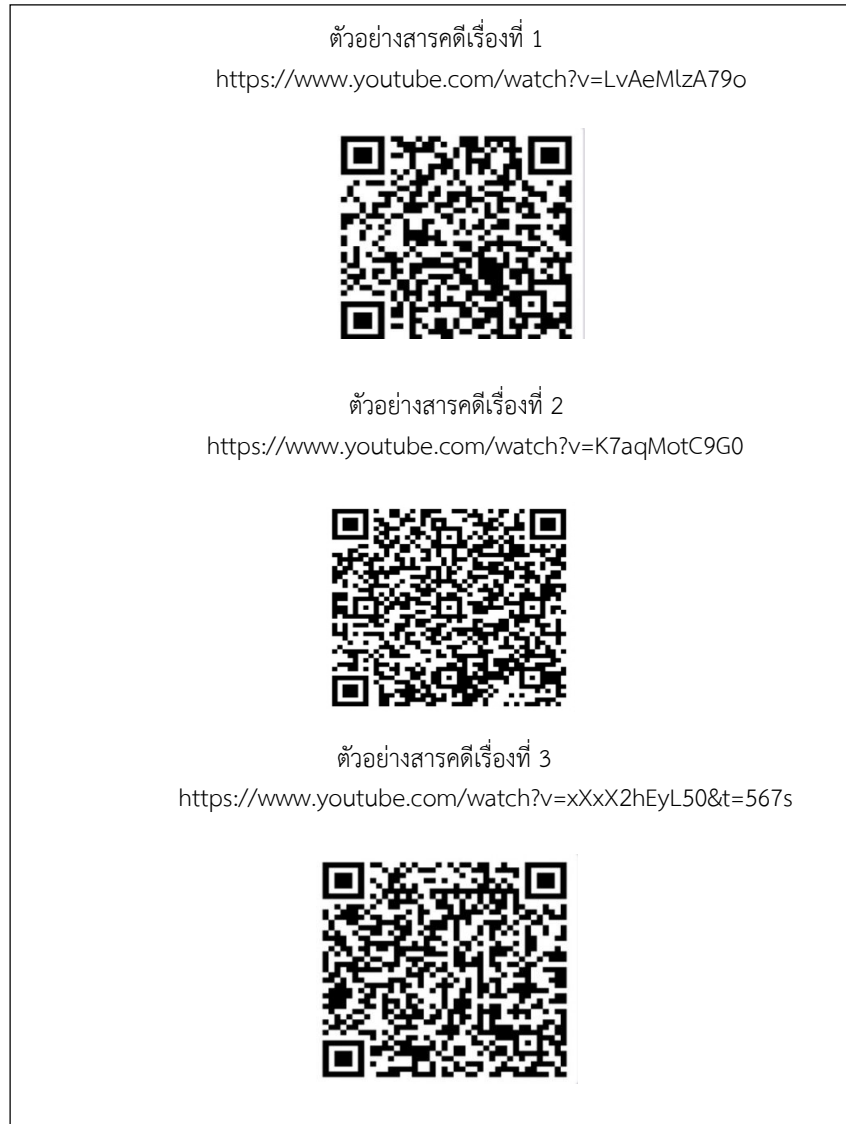
ภาพที่ 3. ตัวอย่างสารคดีสั้นบูรณาการความรู้ทักษะภาษาไทยเพื่อการสื่อสาร

ผลงานสร้างสรรค์ ที่ผู้เรียนรายวิชาภาษาไทยเพื่อการสื่อสาร (มทว 111) ได้จัดทำขึ้นในหัวข้อ “ภาษาไทยและวัฒนธรรมความเป็นไทย” ซึ่งใช้กระบวนการจัดการเรียนรู้โดยใช้ภาระงานเป็นฐาน โดยผู้เรียนได้ออกไปทำกิจกรรมนอกชั้นเรียน ไปถามสอ สัมภาษณ์และลงพื้นที่ชุมชนจริง ดังตัวอย่างสารคดีสั้นต่อไปนี้