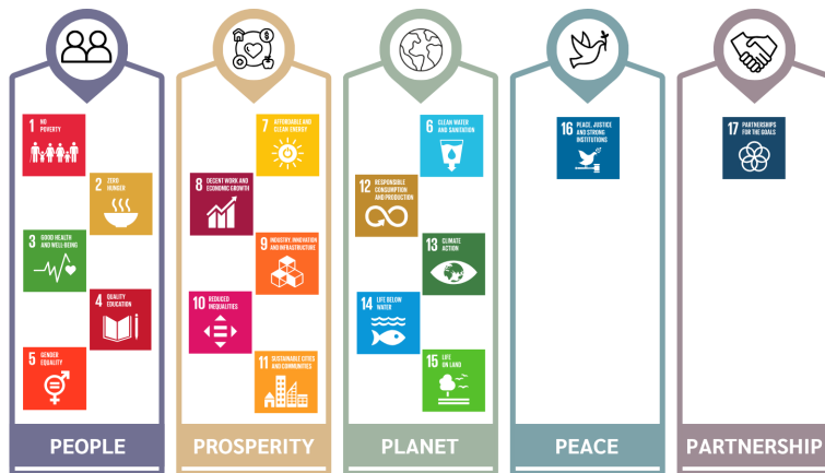
ภาพที่ 1 ความเชื่อมโยงระหว่างเป้าหมายการพัฒนาอย่างยั่งยืนกับกลุ่มการพัฒนา

ประกอบไปด้วย 17 เป้าหมาย 197 เป้าประสงค์ แบ่งเป็น 5 กลุ่ม ดังแสดงในภาพที่ 1