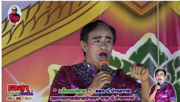
ภาพ 2 ป. ปากควายขับร้องบทเพลง “แก้งบนแม่ยาย” ในการแสดงลิเก